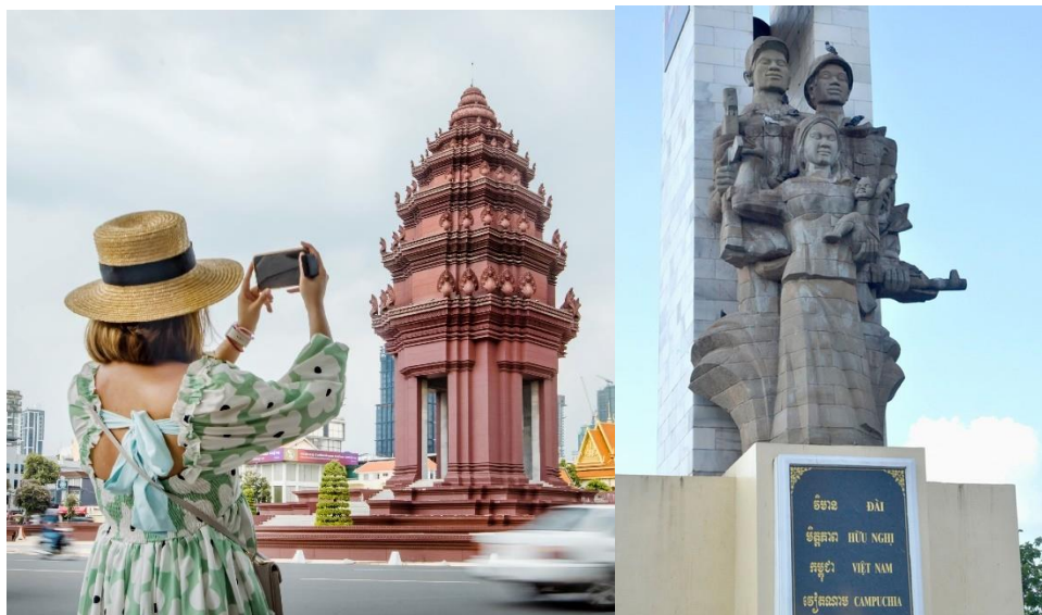
ภาพที่ 7 อนุสาวรีย์เอกราช และอนุสรณ์สถานชัยชนะกลางกรุงพนมเปญ (ภาพออนไลน์)