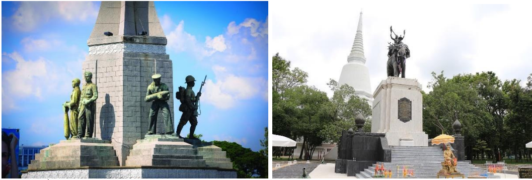
ภาพที่ 5 อนุสาวรีย์ชัยสมรภูมิ และ อนุสรณ์ดอนเจดีย์ชัยชนะแห่งพระนเรศวร

อนุสรณ์สถานแห่งชัยชนะที่เนื่องด้วยศาสนสถานในพระพุทธศาสนา