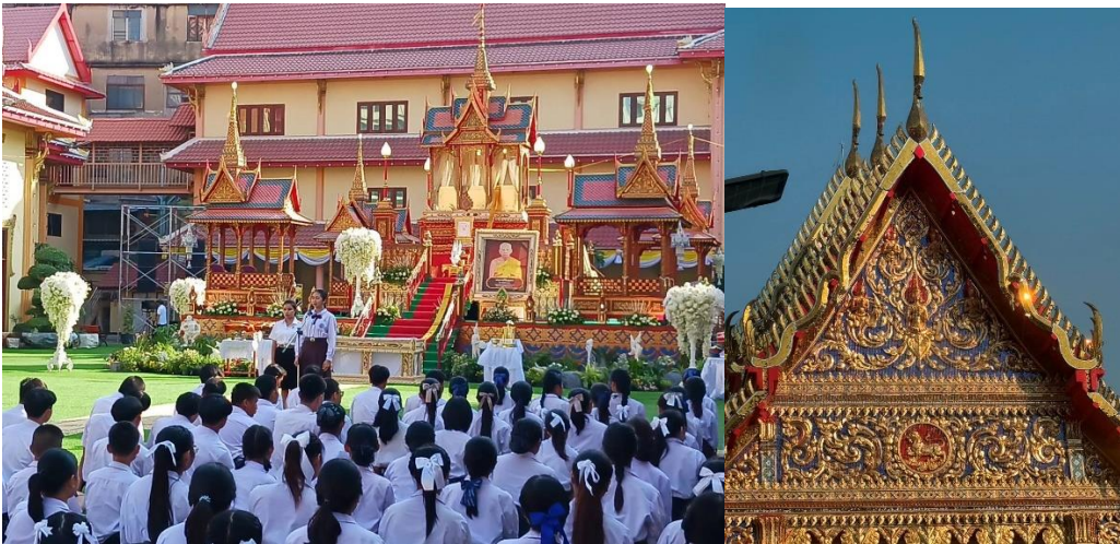
ภาพที่ 2 พิธีพระราชทานเพลิงศพ พระราชวริยະสุนทร (ยิน วรกิจใจ) อดีตเจ้าอาวาสวัดชัยชนะสงคราม (วัดตึก) แลถสถาปัตยกรรมที่สะท้อนความเกี่ยวเนื่องเป็นรูปสิงห์ (เสนีย์) ที่หน้าบ้านอุโบสถวัด