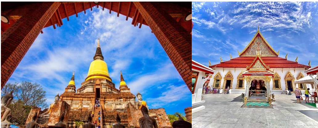
ภาพที่ 4 วัดใหญ่ชัยมงคล อยุธยา วัดชนะสงคราม กทม.

ดังนั้นในเหตุการณ์ที่เนื่องด้วยเจ้าพระยาบดินทร์เดชา จึงเนื่องด้วยความสำคัญดังกล่าว และก่อให้เกิดแนวคิดเรื่องอนุสรณ์สถานกับความเชื่อที่เนื่องด้วยสงคราม ดังนั้นวัดชัยชนะสงครามที่ผู้เขียนเดินทางไปเฝ้าศพ จึงเนื่องด้วยเขมรแต่เป็นการสร้างเพื่อเป็นอนุสรณ์สถาน คติของการสร้างวัดจึงเป็นคติหนึ่งของสังคมไทยหรือบุรพชนของสยามกับการสร้างเพื่อเป็นอนุสรณ์ รวมทั้งคติของการสร้างวัดนัยหนึ่งเพื่อเป็นการไถ่ถอนสำนึกบาปบางประการ อีกนัยหนึ่งเป็นการแสดงออกที่เรียกว่าพลังแห่งศรัทธาในพระพุทธศาสนา และที่สำคัญอาจเป็นคตินิยมของชนชั้นปกครองที่มองว่าการสร้างวัดคือการแสดง “ทาน” ตามหลักของผู้นำในข้อทศพิธราชธรรม จึงกลายเป็นคตินิยมที่ว่าสร้างวัดให้ลูกวิ่งเล่น หรือคิดว่าด้วยการสร้างวัดเพื่อเอาใจชนชั้นนำ ดังคติการสร้างวัดในช่วงสมัยรัชกาลที่ 2 และ รัชกาลที่ 3 กรณีของวัดชัยชนะสงคราม รวมทั้งวัดอื่น ๆ อีกจำนวนมาก แต่ที่ยกมาเป็นคติของการสร้างวัดเพื่อเป็นอนุสรณ์สถานแห่งตระกูลหรือสายตระกูลดังปรากฏในบริบทของสังคมไทย