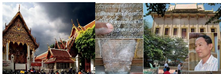
ภาพที่ 3 วัดชัยชนะสงคราม (วัดตึก) กรุงเทพฯ และวัดที่พนมเปญ อนุสรณ์ของเจ้าพระยาบดินทร์เดชา อันเนื่องด้วยสงครามและสัญลักษณ์แห่งชัยชนะ