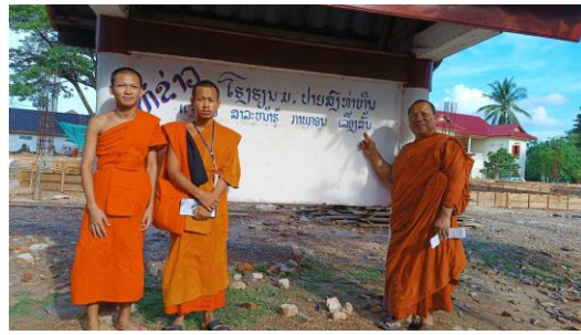
ภาพที่ 9 คณะผู้บริหารคณะสังคมศาสตร์ ให้คำตอบเชิงแนะนำต่อการศึกษาต่อที่ประเทศไทยตามความสนใจของสามเณรชั้นมัธยมสงฆ์ปีที่ 7 ที่สำเร็จการศึกษามัธยมแล้วและต้องการศึกษาต่อ (ภาพผู้เขียน 17 พฤษภาคม 2567)