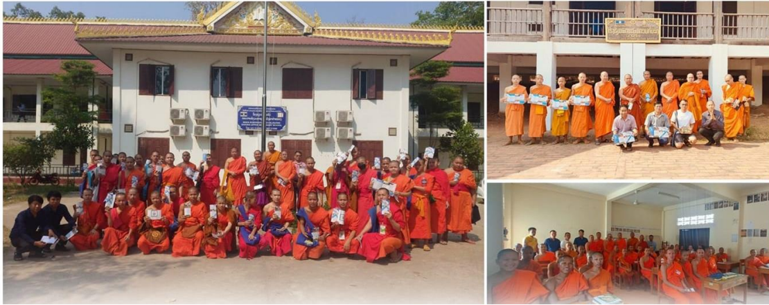
ภาพที่ 2 โรงเรียนสมบูรณสงฆ์วัดผาโอ โรงเรียนสมบูรณสงฆ์วัดภูควาย หลวงพระบาง และวัดโสภป่าหลวงเวียงจันทร์ (ภาพคณะสังคมาศตวรรษ วันที่ 29 กุมภาพันธ์ 2567)