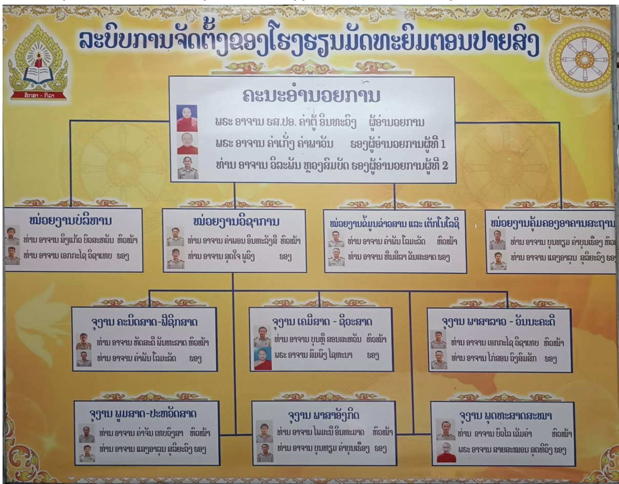
ภาพที่ 8 ผังการบริหารงานงานสถานศึกษา และการบริหารวิชาการ และการศึกษาสงฆ์โรงเรียนวัดท่าหิน จำปาสัก (ภาพผู้เขียน 17 พฤษภาคม 2567)