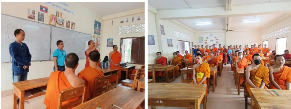
ภาพที่ 3 โรงเรียนสมบูรณสงฆ์วัดภูควาย หลวงพระบาง (ภาพคณะสังคมนาสาตรา วันที่ 29 มีนาคม 2566)

ปลายจำนวน 4 แห่ง จัดการศึกษาสำหรับ ม.ปลาย คือตั้งแต่มัธยม 5-7 อันประกอบด้วย โรงเรียนวัดมหาพุทธวงศาป่าหลวง นครเวียงจันทร์ (พระคันธศีล จันทรสุวงศ์ และคณะ,2564) โรงเรียนมัธยมปลายสงฆ์วัดเวียงพะแก้ว โรงเรียนวัดไชยะพุมิ โรงเรียนมัธยมสงฆ์ปลายวัดท่าหิน จำปาสัก (3) โรงเรียนมัธยมสงฆ์ตอนต้น คือโรงเรียนที่จัดการศึกษาเฉพาะ ม.1-ม.4 (4) โรงเรียนประถมซึ่งจัดโดยคณะสงฆ์ (5) จัดการศึกษาในระดับอุดมศึกษา ซึ่งลาวมีวิทยาลัยสงฆ์ 2 แห่ง คือ วิทยาลัยสงฆ์วัดองค์ตื้อ (The Sangha College Wat Ongtue Mahavihara- อิตะยาไฉง อัดอ์ถึมะทาวอิทาบ ) และวิทยาลัยสงฆ์จำปาสัก (Champasak Sangha college - อิตะยาไฉง จำบาสัก ) ที่จัดการศึกษาระดับปริญญาตรี โดยเป็นสาขาวิชาการสอนพระพุทธศาสนา และภาษาอังกฤษ จากข้อมูลปีล่าสุด 2566-2567 มีจำนวน 331 รูป (ตามตาราง 1) ส่วนสถิติทั้งประเทศมีจำนวนนักศึกษาที่เป็นพระสงฆ์สามเณรทั้งหมด 7,771 องค์ โดยมีครูจำแนกเป็นรัฐกร คือผู้ที่ได้รับเงินเดือนจากหลวงเต็มจำนวน จำนวน 402 คน และครูพระ จำนวน 262 รูป โดยรัฐจัดสรรงบประมาณเป็นนิตยภัตสนับสนุนส่วนหนึ่งประมาณ 70 เปอร์เซ็นต์ และครูผู้ช่วยสอน 149 รูป/คน ซึ่งจะถูกบรรจุเป็นครูพระหรือครูรัฐกรต่อไป (ตามตาราง 1)