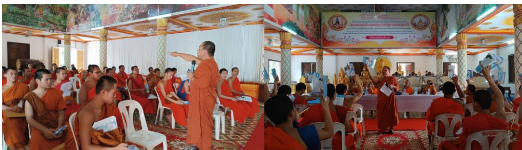
ภาพที่ 4 ผู้บริหารคณาจารย์คณะสังคมนาสาตรา ประชาสัมพันธ์หลักสูตร ณ โรงเรียนมัธยมปลายสงฆ์วัดไชยะพุมิ สะหวันเขต สปป.ลาว (ภาพผู้เขียน 16 พฤษภาคม 2567)

จากภาพ 3-4 คณะผู้เขียนได้ร่วมกิจกรรมประชาสัมพันธ์หลักสูตรในนามคณะสังคมนาสาตรา มหาวิทยาลัยมหาจุฬาลงกรณราชวิทยาลัย เป้าหมายเพื่อแสวงหานิสิตสงฆ์ลาว มาศึกษาต่อในคณะสังคมนาสาตรา ซึ่งข้อดีคือส่วนใหญ่เป็นพระหนุ่มสามเณรน้อยที่สามารถเข้าเรียนในการภาคการศึกษาปกติ โดยมีหลักสูตรภาษาไทยที่พระและสามเณรลาวสามารถเข้ารับการการศึกษาต่อได้ ด้วยภาษาไทยและลาวมีความใกล้เคียงกันมากที่สุด จากประสบการณ์ของการลงพื้นที่ วัดไชยภูมาราม สะหวันเขต สปป.ลาว ผู้บริหารส่วนใหญ่สำเร็จการศึกษาประเทศไทย อาทิ สำเร็จการศึกษาปริญญาเอกจากมหาวิทยาลัยราชภัฏสกลนคร และ