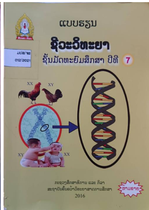
ภาพที่ 10 ตำราเรียนที่เป็นส่วนหนึ่งของหลักสูตรการเรียนการสอนในระดับโรงเรียนมัธยมสงฆ์ตอนปลาย ม.7 ซึ่งเป็นหลักสูตรแกนกลางใช้เหมือนกันทั่วประเทศ (ภาพผู้เขียน 17 พฤษภาคม 2567)