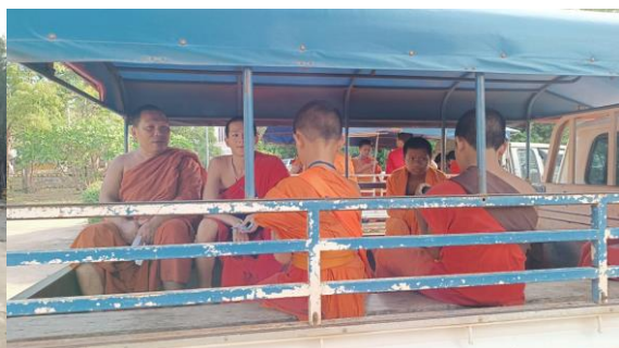
ภาพที่ 11 การเดินทางมาเรียนและกลับของสามเณรที่วัดท่าหิน สอบถามสามเณรรูปหนึ่งบอกว่าเดือนละแสนห้า เป็นค่ารถรายได้ เจ้าอาวาสสนับสนุนทุนการศึกษาและค่ารถด้วย (ภาพผู้เขียน 17 พฤษภาคม 2567)

จากภาพ 5-11 จะเป็นบรรยากาศภาพรวมของการมาประชาสัมพันธ์หลักสูตรโรงเรียนมัธยมสงฆ์วัดท่าหิน จำปากสั๊ก ที่สะท้อนถึงข้อมูลเชิงพื้นที่ที่เป็นเหตุการณ์ขณะที่เข้าพื้นที่เพื่อสำรวจข้อมูลและ