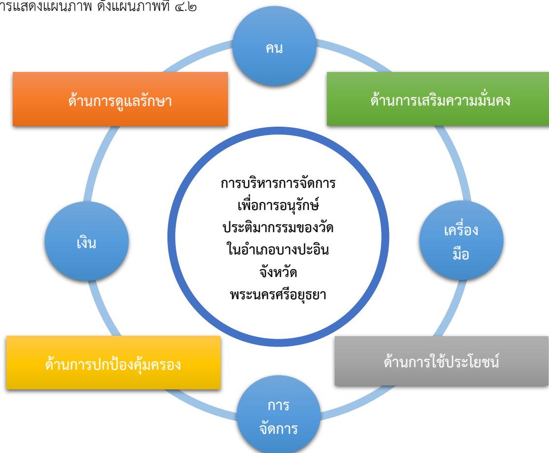
แผนภาพที่ ๔.๒ องค์ความรู้ที่ได้สังเคราะห์จากการวิจัย

จากการศึกษาเรื่อง “การบริหารการจัดการเพื่อการอนุรักษ์ประติมากรรมของวัดในอำเภอบางปะอิน จังหวัดพระนครศรีอยุธยา” ผู้วิจัยได้สรุปองค์ความรู้ที่ได้สังเคราะห์จากการวิจัยโดยการแสดงแผนภาพ ดังแผนภาพที่ ๔.๒