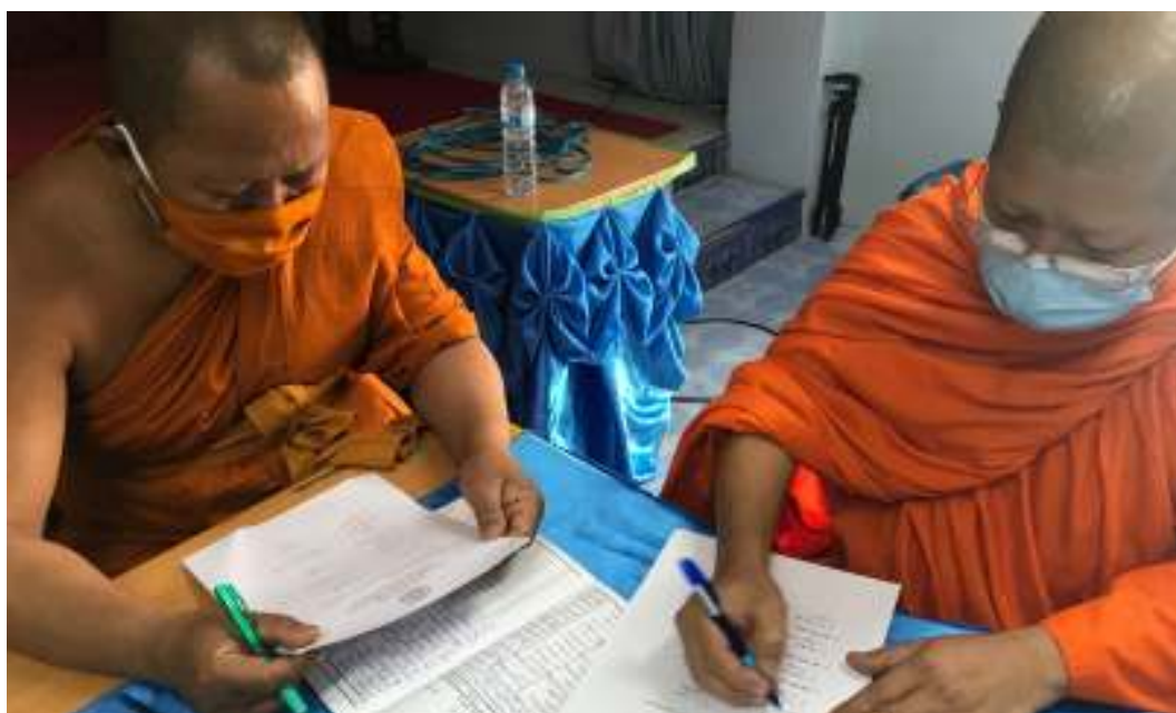
สัมภาษณ์ พระมหาวิชัย ติกขปญฺโญ ตำแหน่งเจ้าคณะตำบลวังน้ำเย็น คลองหินปูนเขต ๔