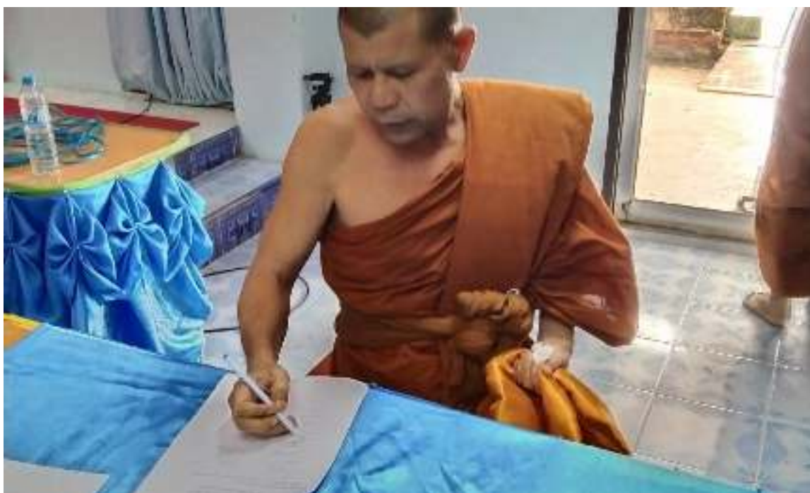
เก็บข้อมูลแบบสอบถาม