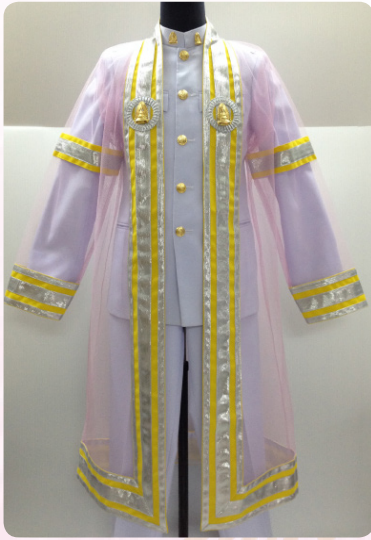
ครุยวิทยฐานะระดับบัณฑิต คณะพุทธศาสตร์