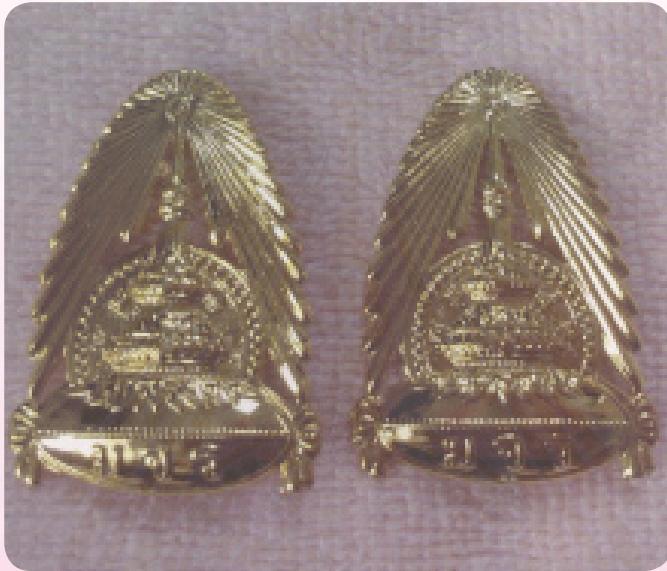
ภาพแสดงตัวอย่างเข็มวิทยฐานะ มหาวิทยาลัยมหาจุฬาลงกรณราชวิทยาลัย