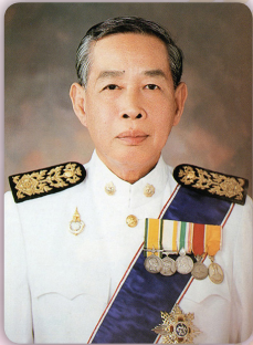
ศ.พิเศษจางค์ ทองประเสริฐ ราชบัณฑิต