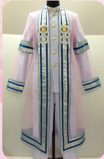
ครุยวิทยฐานะระดับมหาบัณฑิต