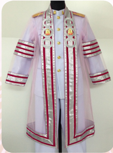
ครุยวิทยฐานะประจำตำแหน่งคณาจารย์หรือผู้บริหารวิชาการ