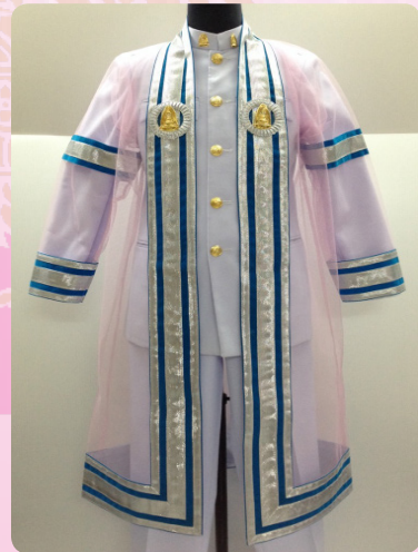
ครุยวิทยฐานะระดับบัณฑิต คณะสังคมศาสตร์