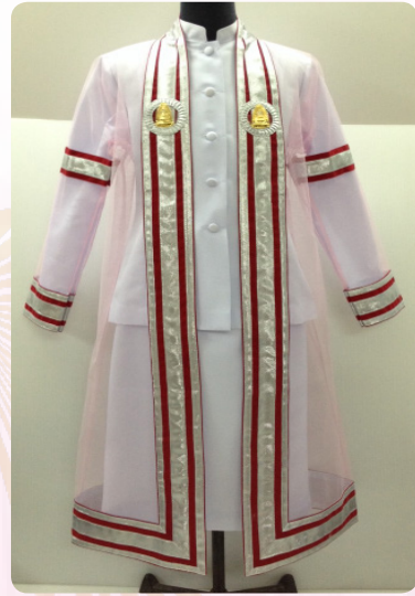
ครุยวิทยฐานะระดับบัณฑิต คณะครุศาสตร์