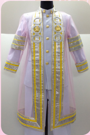
ครุยวิทยฐานะระดับคณาจารย์บัณฑิต