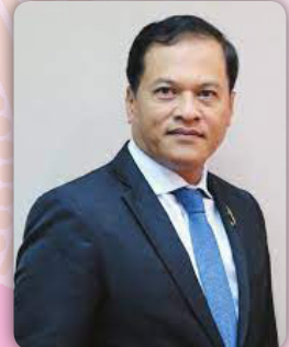
ดร.อรรถพล สังขวาสี เลขาธิการสภาการศึกษา