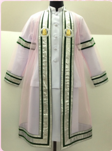
ครุยวิทยฐานะระดับบัณฑิต คณะมนุษยศาสตร์