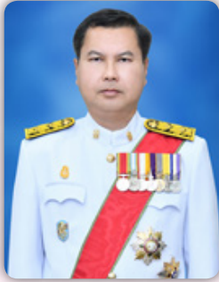
ดร.สุภัทร จำปาทอง ปลัดกระทรวงศึกษาธิการ