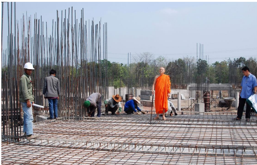
พระเดชพระคุณ พระเทพญาณมงคล (หลวงป่า)