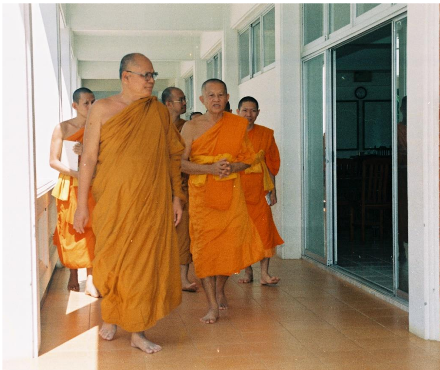
พระเดชพระคุณ พระเทพญาณมงคล (หลวงป่า) ถวายการต้อนรับ เจ้าประคุณสมเด็จพระพุทธชินวงศ์ เจ้าคณะใหญ่หนกลาง เยี่ยมชมโรงเรียนพระปริยัติธรรม ในยุคแรกๆ