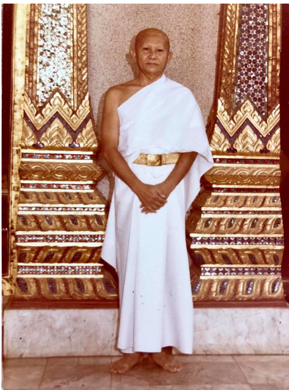
ภาพหลวงป่า สมัยเป็นนาคก่อนเข้าบรรพชาอุปสมบท เมื่อวันที่ 6 มีนาคม 2529

ณ พระอุโบสถพัทธสีมาวัดปากน้ำ ภาษีเจริญ กรุงเทพฯ