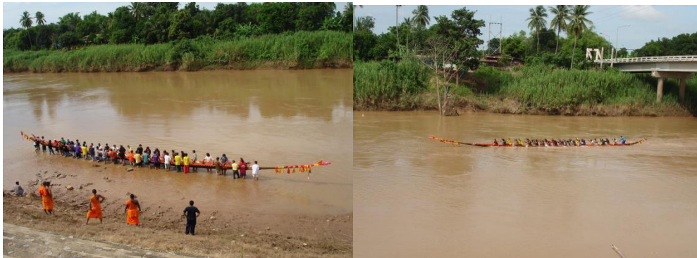
ภาพที่ 2 การนำเรือทดลองก่อนแข่งในช่วงฤดูการแข่งประจำปี ที่สะท้อนให้เห็นถึงวิถีแห่งเรือ กับสายน้ำ ภายใต้บทบาทพระสงฆ์จังหวัดพิจิตรกับการอนุรักษ์ประเพณีแข่งเรือ

ด้านสังคมมีผลกระทบทั้งเชิงบวกและลบ ปัญหาหลักก็คือ เงินทุนและการบริหารจัดการ ลักษณะที่ควรเป็นในการอนุรักษ์ประเพณีนี้คือ การบริหารจัดการแบบมีส่วนร่วมและต้องผลักดันให้เป็นประเพณีวัฒนธรรมในระดับจังหวัดจึงจะสามารถอนุรักษ์สืบได้ตลอดไป...”