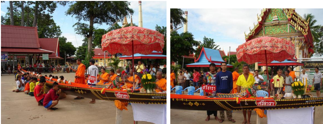
ภาพที่ 1 พิธีบวงสรวงเรือเพื่อความเป็นสิริมงคลก่อนนำแข่ง สะท้อนบทบาทพระสงฆ์ วัด กับการอนุรักษ์ประเพณีการแข่งขันเรือ จ.พิจิตร (ภาพ : พระครูพิจิตรวรวาท วัดท่าพ้อ,4 มีนาคม 2564)

เฉลิมฉลองความอุดมสมบูรณ์ของชุมชนหลังฤดูกาลเก็บเกี่ยว ต่อมารัฐบาลไทยได้ใช้ประเพณีดังกล่าวเชื่อมความสัมพันธ์ระหว่างประเทศไทยกับประเทศสาธารณรัฐประชาธิปไตยประชาชนลาว ตลอดจนการตอบสนองนโยบายการส่งเสริมการท่องเที่ยวของประเทศเพื่อเป็นการเพิ่มรายได้ให้แก่ชุมชน ภาครัฐและเอกชนอีกด้วย