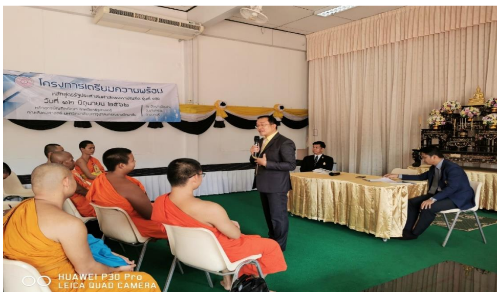
รูปภาพประกอบกิจกรรม โครงการเตรียมความพร้อมสำหรับนิสิตก่อนเปิดภาคการศึกษา ระดับปริญญาโท ประจำปีการศึกษา ๒๕๖๒