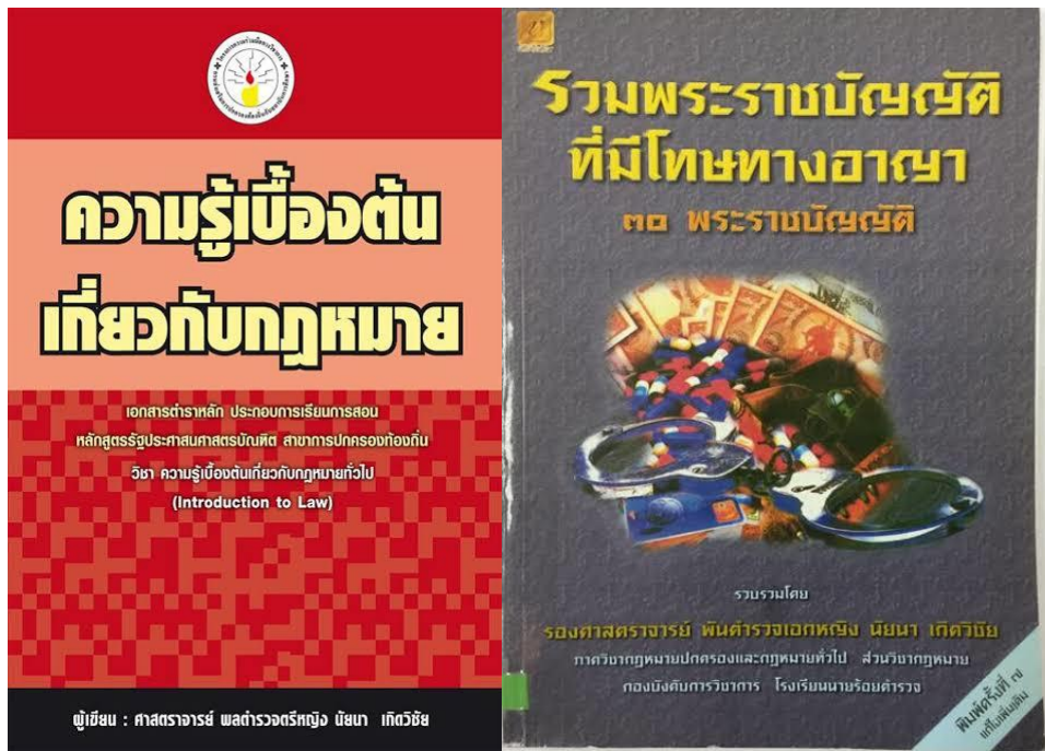
ภาพที่ 3 มรดกทางปัญญา หนังสือ ตำราทางกฎหมายในนาม สำนักพิมพ์นิติเนย์