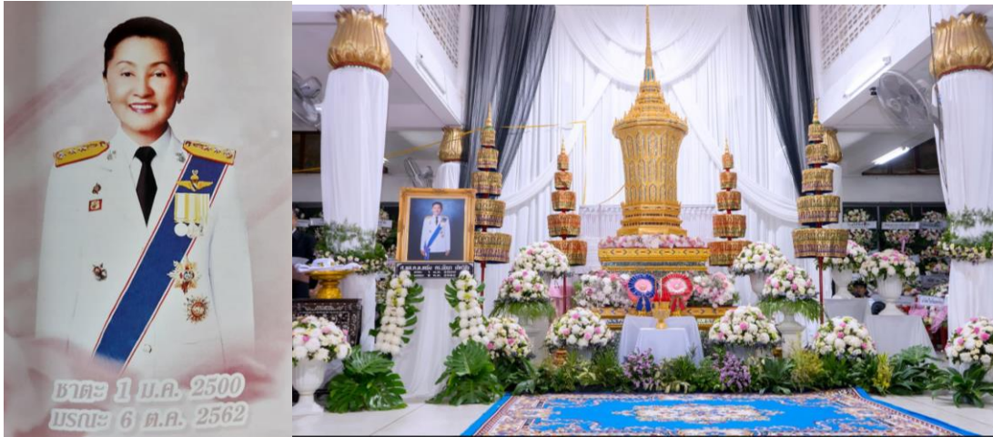
ภาพที่ 1 ภาพหน้าตรงภาพจากหนังสืองานศพ และภาพในงานบำเพ็ญกุศลศพ ระหว่าง 6-14 ตุลาคม 2562 (ที่มา จากดินสุ่ฟ้า นัยนา...ลาลับสู่สวรรค์)

ในความสำเร็จในแบบอย่างของคนสำเร็จ คุณค่าในฐานะที่เป็นองค์ความรู้ผ่านตัวหนังสือ ที่จะโลดแล่นเป็นเอกลักษณ์โดดเด่นเป็นสง่าควรค่าแก่การจดจำหรือให้จดจำ จนเป็นที่มาของหนังสืองานศพ เพื่อการแนะนำนำมาเล่าแบ่งปันสะท้อนคิดว่าเมื่อได้หนังสือมาผู้เขียนคิดอย่างไร ? และนำอะไรมาเล่าต่อเพื่อสะท้อนให้เห็นว่าชีวิตที่น่าจดจำ เป็นแบบอย่าง และสร้างแรงบันดาลใจของอาจารย์ผ่านการสะท้อนเล่าเรื่องจากคนอื่นเป็นอย่างไร จึงขอร่วมบันทึกเป็นอนุสรณ์แห่งความทรงจำร่วมกับท่านอาจารย์ไว้ ณ ตรงนี้ด้วยความนับถือ