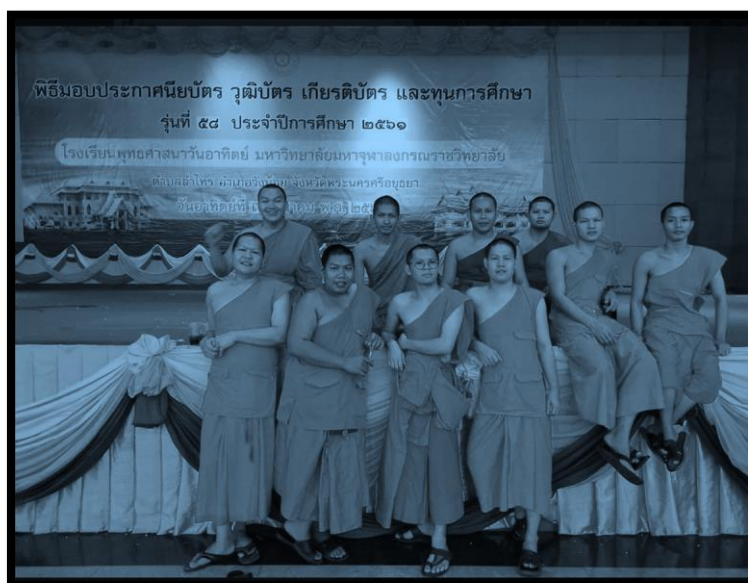
ภาพ 1 ภาพสะท้อนความเป็นเพศ ในมหาวิทยาลัยสงฆ์ ที่ผ่านการอยู่ร่วม ศึกษา ร่วม และใช้ชีวิตร่วมอยู่อาศัย (ภาพออนไลน์ 28 กุมภาพันธ์ 2562)

ดังนั้นในการเขียนบทศึกษานี้จึงประสงค์ศึกษาถึงทัศนะจากการพบเห็น อยู่ร่วม ของนิสิตมหาวิทยาลัยสงฆ์ ที่พบเห็นร่วมเรียนในสถานะนิตินของมหาวิทยาลัย โดยสืบใช้ตามเกณฑ์ของพระธรรมวินัยที่ปรากฏใช้ใน ประเทศของของตนเอง รวมทั้งเกณฑ์ทางสังคมต่อการยอมรับ และทัศนคติส่วนตัว ต่อการพบเห็นที่มีอยู่อันเป็นแนวปฏิบัติ ที่ปรากฏด้วยตาเนื้อ พบเห็น ไปสู่การยอมรับ หรือโต้แย้งกลายเป็น การศึกษา จะได้สะท้อนคิดผ่านการเล่าเรื่องสะท้อนมุมมอง ในความเป็นเพศสภาพอันเป็นเพศรส หรือเพศสถานะของความเป็น “บรรพชิต” นักบวช รวมถึงทัศนคติในเชิงสังคมต่อความเป็นเพศสภาพ หรือเพศทางเลือกใน พระพุทธศาสนาจากพระภิกษุสามเณรประเทศเถรวาทอาเซียนมีทัศนคติหรือความคิดเห็นอย่างไร ? ซึ่งจะได้ ทำการศึกษาและอธิบายต่อไป