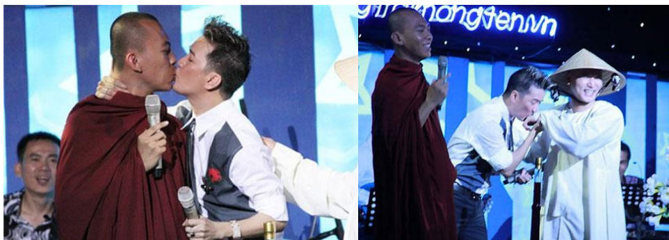
ภาพ 4 ภาพที่สะท้อนถึงรสนิยมทางเพศของพระเวียดนามที่ขณะการประมูลของใช้ส่วนตัวนักร้องดัง Vinh Hung ชาวเวียดนาม แต่ได้กลายเป็นประเด็นในความเป็นเพศกับสถานะนักบวชในประเทศเวียดนาม

กรณีเวียดนามเคยเป็นข่าวในเชิงภาพลักษณ์ทางสื่อออนไลน์ แต่ก็สอบถามข้อมูลเป็นการที่พระภิกษุใช้สื่อออนไลน์ในการสะท้อนรสนิยมเฉพาะ ทำให้เกิดกระแสวิพากษ์ในช่วงหนึ่ง แต่กรณีประเทศไทยเราก็จะมีประเด็นในลักษณะดังกล่าว ต่างกรรมต่างวาระกันในเรื่องภาพลักษณ์ต่อสาธารณะ และในความเป็นสาธารณะนั้น ได้สะท้อนปรากฏการณ์ของความหลากหลายและความชื่นชอบในรสนิยมที่แตกต่างกันและในความแตกต่างได้ก่อให้เกิดการขับเคลื่อนเป็นพฤติกรรมและภาพลักษณ์ต่อสาธารณะด้วยเช่นกัน