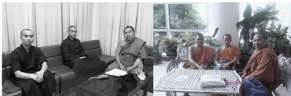
ภาพ 5 ผู้เขียนสัมภาษณ์สะท้อนทัศนคติคนนิสิตเวียดนาม ลาว กัมพูชา และพม่า ต่อประเด็นความหลากหลายทางเพศต่อการบวช รวมทั้งวิถีสังคมของแต่ละประเทศในอาเซียน (2 มีนาคม 2562)