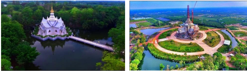
ภาพที่ 3 การจัดสร้างรมณีสถานภายในวัดหลวงพ่อดุสิตเพื่อเป็นฐานในการสร้างงานพระพุทธศาสนา (วัดหลวงพ่อดุสิตธรรมกายาราม อ. ดำเนินสะดวก จ. ราชบุรี, ม.ป.ป.)

ดังนั้น สิ่งที่กำลังมาจึงเป็นการสะท้อนงานที่ท่านปฏิบัติ ซึ่งผู้เขียนเห็นว่า เป็นจริยาวัตรที่เป็นการบำเพ็ญประโยชน์ตน (อัตตहितประโยชน์) และประโยชน์ส่วนรวมอย่างไม่จำกัด (ปริहितประโยชน์) ตามคติพระพุทธศาสนาเป็นหัวใจของการทำงาน อันเป็นการรักษา สืบทอดอายุพระพุทธศาสนา ผ่านการสร้างคน สร้างงานและพื้นที่ในการทำงานที่วัดหลวงพ่อดุสิตธรรมกายาราม จังหวัดราชบุรี