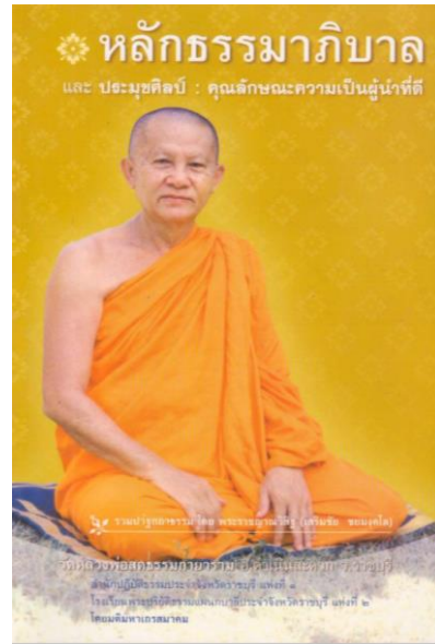
ภาพที่ 4 มรดกธรรมของพระเทพญาณมงคล (เสริมชัย ชยมงคล) (วัดหลวงพ่อดธรรมกายาราม (ม.ป.ป.).