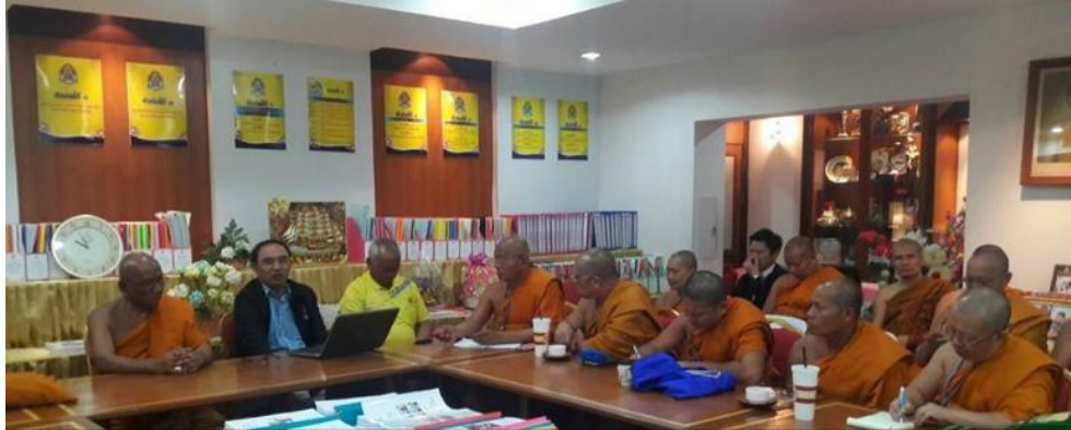
ภาพที่ 1 ถอดบทเรียนการดำเนินการและการบริหารโรงเรียนการกุศลของวัด

พระพุทธศาสนาภายใต้กรอบของการให้ การพัฒนาทรัพยากรมนุษย์ให้กับสังคมและพระพุทธศาสนาในองค์รวม และทำหน้าที่ของพระสงฆ์ในการสอดคล้องคุณธรรม จริยธรรมด้วยเป็นโรงเรียนของวัด ซึ่งตั้งอยู่ในวัด และใช้อาคารภายในวัดเป็นสำนักงาน ห้องเรียน และบริหารโดยพระภิกษุในพระพุทธศาสนา เป็นต้น