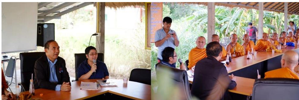
ภาพที่ 4 การแลกเปลี่ยนเรียนรู้ ถอดบทเรียนวิถีเกษตรแบบพอเพียงพุทธเกษตรไม่เบียดเบียน

การดำเนินงานตามโครงการเสริมสร้างความเข้มแข็งชุมชน “คนเพชร” ตามปรัชญาเศรษฐกิจพอเพียง แสดงให้เห็นถึงความพร้อม ความสามัคคีความสมานฉันท์เป็นน้ำหนึ่งใจเดียวกันและความเสียสละช่วยเหลือเกื้อกูลซึ่งกันและกันของประชาชนในตำบล มีเป้าหมายเพื่อร่วมกันพัฒนาตำบลอย่างต่อเนื่อง โดยเริ่มต้นที่ตัวชุมชนเองก่อน จากนั้นได้พัฒนาโครงการขึ้นเรื่อย ๆ เพื่อให้ชุมชนเข้มแข็ง ประชาชนทุกคนในตำบล มีคุณภาพชีวิตที่ดีมีความสุข