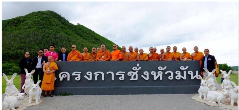
ภาพที่ 3 การศึกษาแนวคิดเศรษฐกิจพอเพียงที่โครงการซังห้วมันตามพระราชดำริ

พระบาทสมเด็จพระเจ้าอยู่หัว รัชกาลที่ 9 เสด็จพระราชดำเนินทอดพระเนตรความคืบหน้าโครงการด้วยพระองค์เอง เมื่อวันที่ 1 สิงหาคม พ.ศ. 2552 มีงานวิจัยจำนวนมากที่ทำความเกี่ยวกับเศรษฐกิจพอเพียง สะท้อนคิดให้เห็นว่า เป็นทางเลือกสำหรับชีวิต และสะท้อนถึงความมั่นคงของอาหารที่เป็นหัวใจสำคัญอาหารเป็นปัจจัย 4 หรือปัจจัยหลักตามหลักคำสอนในทางพระพุทธศาสนา เทียบเคียงกรณีของคานธี ซึ่งสะท้อนคิดไว้ว่า อาหารมีเพียงพอสำหรับประชากรในโลกนี้แต่มีไม่เพียงพอสำหรับความโลภของมนุษย์