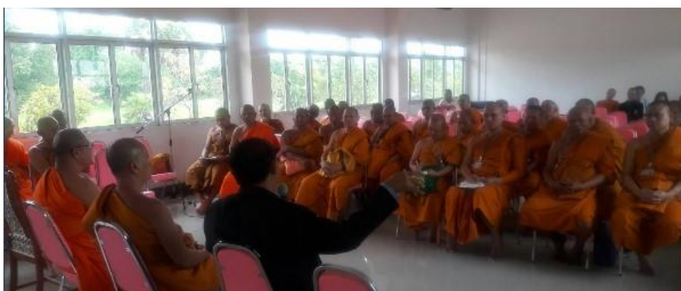
ภาพที่ 2 ถอดบทเรียนการดำเนินการและการบริหารหน่วยวิทยบริการฯ

หน่วยวิทยบริการคณะสังคมศาสตร์ ตั้งอยู่ที่วัดพระรูป อำเภอเมือง จังหวัดเพชรบุรี เป็นสถานศึกษาของคณะสงฆ์จังหวัดเพชรบุรี ที่มองเห็นประโยชน์ของการบริหารกิจการคณะสงฆ์ (พระวิสุทธีวรกิจ, 2559) ในฐานะผู้บริหารหน่วยได้เล่าให้ฟังในเชิงของการให้ข้อมูลว่า (1) การก่อตั้งหน่วยวิทยบริการเป้าหมายเพื่อประโยชน์ต่อการพัฒนาคุณภาพพระสงฆ์ในเขตจังหวัดและจังหวัดอื่น ๆ (2) การใช้ทุนทางสังคมในการบริหารในการพัฒนาสู่การยกเป็นวิทยาลัยสงฆ์จะทำให้พระมีสถาบันการศึกษารองรับการพัฒนาตนเอง ทั้งทำให้พระสงฆ์ระดับบริหารมีประสิทธิภาพในการทำงานมากขึ้น และสถาบันการศึกษาเป็นศูนย์กลางในการบริหารกิจการคณะสงฆ์ไปด้วย ในส่วนเยาวชนประชาชนที่เข้ารับการศึกษานำความรู้ไปพัฒนาตนเองสู่การเข้าสารบบของอาชีพต่อไป