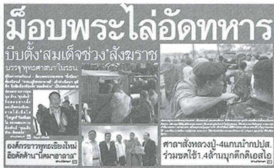
ภาพที่ 1 ภาพข่าวว่าด้วยประเด็นสังฆราช

ปรากฏการณ์ความขัดแย้งว่าด้วย “สังฆราช” เป็นประเด็นทางศาสนาที่เกิดขึ้นช่วงปัจจุบัน ดังปรากฏผ่านสื่อรวมทั้งเหตุการณ์การชุมนุม เมื่อ 15 กุมภาพันธ์ 2559 ที่พุทธมณฑล ซึ่งเป็นเหตุการณ์ที่ใช้แนวคิดทางศาสนานำแต่แฝงไว้ด้วยประเด็นการต่อสู้ทางการเมือง อย่างมีนัยยะตำแหน่งสมเด็จพระสังฆราชถูกหยิบยกขึ้นมาผสมกับประเด็นทางการเมือง [พระเสื่อแดง-โดยถูกย่อนแย้งจากฝ่ายการเมืองตรงข้ามด้วย] โดยการต่อสู้ช่วงชิงนี้ได้ก่อให้เกิดผลกระทบ ทั้งในเชิงหลักการ