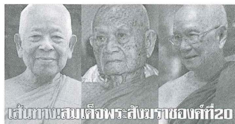
ภาพที่ 2 ว่าที่สมเด็จพระสังฆราชองค์ที่ 20

สังคมอย่างที่ปรากฏมา ในช่วงเวลาหลายปีที่ผ่านมา เฉพาะในส่วนสังฆราช จะสามารถนำเกณฑ์ มาอภิปรายและยกเป็นกรณีศึกษาได้ คือ (1) พระธรรมวินัยมีความสำคัญ ควรศึกษาทำความเข้าใจให้เห็นถึงแนวคิดในการบัญญัติพระธรรมวินัยของพระพุทธเจ้าที่ว่า “ธรรมวินัย เป็นผู้นำสูงสุด” แปลว่าหลักธรรมวินัยต้องสำคัญที่สุด (2) หลักกฎหมายซึ่งเป็นกลไกที่ถูกสร้างซ้อนขึ้นมาในภายหลังเพื่อสนับสนุน “พระธรรมวินัย” ที่จะใช้เป็นเครื่องมือในการบริหารกิจการคณะสงฆ์ ในเมื่อกฎหมายบัญญัติไว้อย่างไรต้องปฏิบัติตามอย่างนั้น? (3) ธรรมเนียมประเพณี [โบราณราชประเพณี] ถูกยกขึ้นมาเป็นประเด็นผ่านการตีความและให้คำอธิบายว่า ธรรมเนียมเดิมเป็นอำนาจของพระเจ้าแผ่นดิน ในเมื่อพระเจ้าแผ่นดินมีอำนาจ ก็ต้องเปิดโอกาสให้พระเจ้าแผ่นดินทรงพระราชวินิจฉัย หรือทรงแต่งตั้ง (4) การรักษาพระธรรมวินัย หลักการสูงสุดของพระพุทธศาสนา “ความหมดจด สะอาด สว่าง สงบ หรือความสว่างงามต่อตำแหน่ง “พระธรรมวินัย” ถูกหยิบขึ้นมาเป็นปรากฏการณ์ร่วมในการอธิบายคุณสมบัติของสมเด็จพระสังฆราชอย่างไม่เคยปรากฏมีมาก่อนในสังคมไทย ทั้งหมดเป็นประเด็นที่นำไปสู่การพิจารณาเกณฑ์การได้มาซึ่งสังฆราชองค์ที่ 20 อันจะพึงมีขึ้นในสังคมไทย ควรมีหลักคิด ชุดคำ ทั้งพระธรรมวินัย กฎหมาย และเกณฑ์ทางสังคมในการอธิบายหรือทำความเข้าใจต่อปรากฏการณ์นี้อย่างไร ?