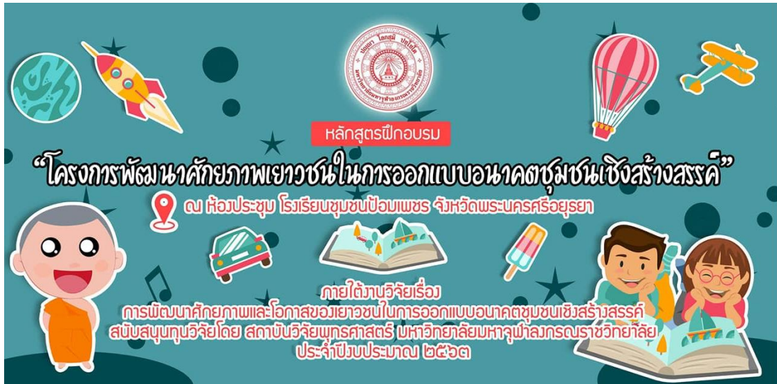
ภาพที่ 1 ป้ายประชาสัมพันธ์โครงการฝึกอบรมการขับเคลื่อนกิจกรรม ศักยภาพเยาวชนในการออกแบบอนาคตชุมชนสร้างสรรค์ โรงเรียนชุมชนป้อมเพชร จังหวัดพระนครศรีอยุธยา (ภาพขณะนักวิจัย, 20 กรกฎาคม 2563)