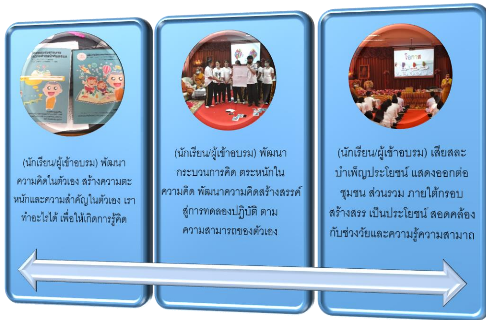
ภาพที่ 7 ผังถอดความคิดต่อการฝึกอบรมชุมชนสร้างสรรค์ ที่สอดคล้องกับศักยภาพและความสามารถของ นักเรียนโรงเรียนชุมชนป้อมเพชร จ.พระนครศรีอยุธยา

จากภาพที่ 7 สะท้อนให้เห็นว่าชุดฝึกอบรม ที่ใช้ในการอบรมนักเรียนชุมชนป้อมเพชร มีผลเชิง ประจักษ์เป็นพัฒนาการสำหรับนักเรียนที่เข้าร่วมอบรม โดยสามารถสะท้อนคิดจากครู นักเรียน และผู้เข้า อบรมได้ คือ