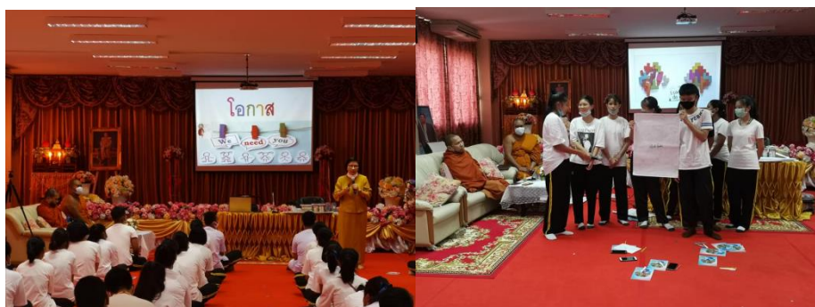
ภาพที่ 4 วิทยากรกระบวนการ พาทำกิจกรรมชุมชนคิด ชวนคุย ชวนทำ (ภาพคณบดีนักวิจัย, 20 กรกฎาคม 2563)

จากข้อความด้านบนของนักเรียนทั้งหมดประมวลเป็นข้อเสนอที่ได้รับการคัดเลือกเพื่อให้นักเรียนผู้เข้ารับการอบรมได้ลงมือปฏิบัติ หรือเพื่อการลงมือปฏิบัติ ซึ่งเป็นความคาดหวังจากคณบดีนักวิจัยว่านักเรียนสามารถลงมือทำได้ และคณะครูผู้ทำหน้าที่ในการกำกับเป็นพี่เลี้ยงก็เล็งเห็นว่าเป็นประโยชน์ และนักเรียนได้รับการสนับสนุนให้เกิดเป็นกิจกรรมภายใต้แนวคิดเยาวชนสร้างสรรค์ พวกเราได้ทำได้