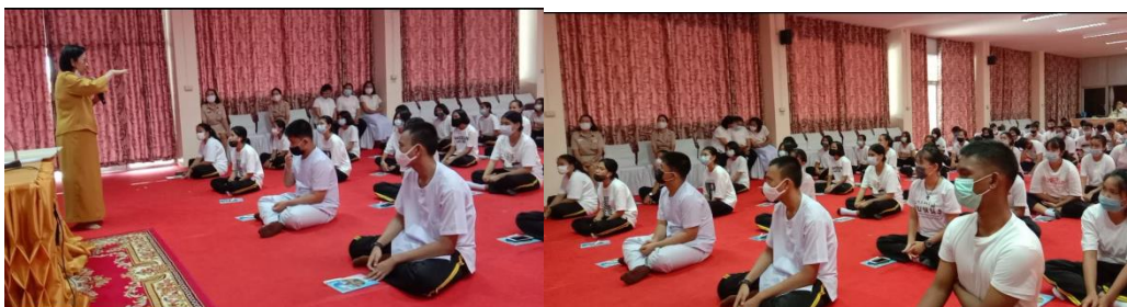
ภาพที่ 3 วิทยากรกระบวนการ พาทำกิจกรรมชุมชนคิด ชวนคุย ชวนทำ (ภาพคณะนักวิจัย, 20 กรกฎาคม 2563)

กิจกรรมที่ 2 กิจกรรมกระจกสะท้อนใจ การสะท้อนคิดภายใต้กรอบ เราจะแสดงออกต่อตัวเองอย่างไร รวมไปถึงจะสร้างการมีส่วนร่วมต่อชุมชนได้อย่างไร จึงจะทำให้เกิดการขับเคลื่อนเป็นพลังในการพัฒนาตนเอง เช่น (1) เรามีความสามารถอะไร (2) เราจะช่วยเหลือสังคมได้อย่างไร (3) เราจะนำสิ่งที่คิดว่าจะเป็นประโยชน์ต่อชุมชนได้อย่างไร หนึ่งหนึ่งเป็นการชวนถอดความสามารถของนักเรียนเอง (4) เป็นการชวนคิดและคอยภายใต้ความเป็นไปได้ และขับเคลื่อนให้เกิดการทำงานร่วมกัน และส่งเสริมให้เกิดพลังในการทำกิจกรรมร่วมกัน