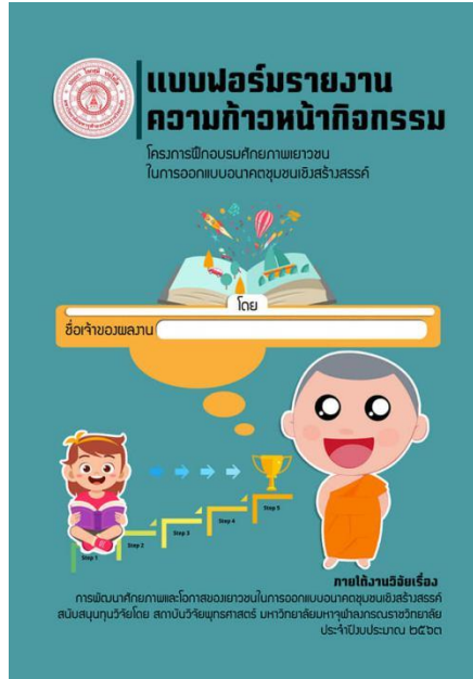
ภาพที่ 2 คู่มือฝึกอบรม คู่มือการขับเคลื่อนกิจกรรม ศักยภาพเยาวชนในการออกแบบอนาคตชุมชนสร้างสรรค์ โรงเรียนชุมชนป้อมเพชร จังหวัดพระนครศรีอยุธยา (ภาพคณະนักรวิจย, 20 กรกฎาคม 2563)