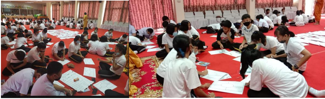
ภาพที่ 5 นักเรียนชุมชนป้อมเพชร จ.พระนครศรีอยุธยา กับกิจกรรมสะท้อนคิด ดึงศักยภาพของตัวเองเพื่อการออกแบบชุมชนสร้างสรรค์ (ภาพขณะนักวิจัย, 20 กรกฎาคม 2563)

จากการสังเกตการณ์และสะท้อนคิดถอดประสบการณ์ผ่านนักเรียน ครู จะพบว่า ครู และตัวนักเรียนเองได้ให้ข้อมูลไว้คล้าย ๆ กันว่า กิจกรรมแบบนี้มีประโยชน์ เสริมสร้างทักษะการคิดเชิงปฏิบัติการเชิงระบบ และทำให้นักเรียนกล้าคิด กล้าทำ กล้าแสดงออก “โครงการนี้จะช่วยให้เด็กฝึกความคิดสร้างสรรค์ รู้จักเข้าถึงชุมชนแล้วก็ทำให้เกิดประโยชน์ต่อชุมชน” (ครูโรงเรียนชุมชนป้อมเพชร,สัมภาษณ์,20 กรกฎาคม 2563) นับเป็นประโยชน์ในเชิงกระบวนการกลุ่ม “ทำให้พวกเรากล้าคิด กล้าแสดงออก และมีความมั่นใจในสิ่งที่เราจะคิด และนำเสนอ และอาจลงมือทำต่อไป” (นักเรียนโรงเรียนชุมชนป้อมเพชร,สัมภาษณ์,20 กรกฎาคม 2563) ทักษะเชิงประจักษ์ เป็นการสะท้อนคิด และสังเกตในช่วงแรกนักเรียนยังไม่คุ้นชินกับกิจกรรม แต่เมื่อเข้าใจและเห็นว่าเป็นพื้นที่ของนักเรียนเองได้ ทำให้นักเรียน กล้าคิด และกล้าแสดงออก นัยหนึ่งเป็นการพัฒนาทักษะกระบวนการคิด ผ่านตนเอง การคิดผ่านกระบวนการกลุ่ม และการคิดเชิงระบบแบบองค์รวม นำไปสู่การออกแบบระบบคิดเพื่อนำไปสู่การปฏิบัติร่วมกัน ครูช่วยแนะนำ คณะวิทยากรเป็นที่เลี้ยงคอยกำลัง จะทำให้เป็นประโยชน์ต่อการเรียนรู้ของนักเรียนด้วย