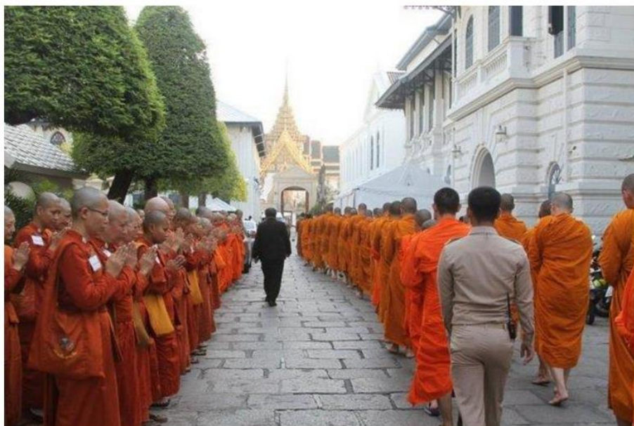
A row of female monks (left), after being barred from paying respect to the late monarch, paid respect to the monks who are escorted into the Grand Palace to attend the royal ceremony.

ภาพที่ ๑ กรณีความขัดแย้งว่าด้วยภิกษุณีห้ามเข้าวังด้วยเหตุไม่มีสถานะของนักบวช ปรากฏเป็นภาพข่าว และสื่อสิ่งพิมพ์ทั้งในระดับชาติและนานาชาติ