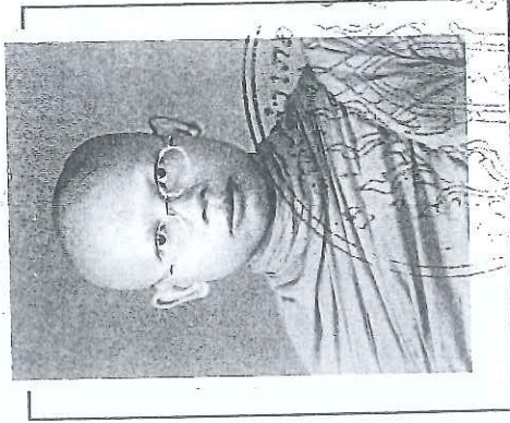
(ลงลายมือชื่อ-ฉายา) - / กษ