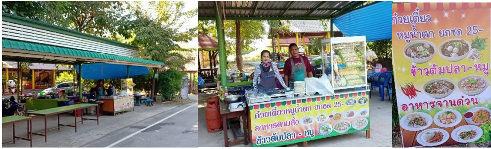
ภาพที่ 6 ร้านค้าชุมชนกับการขับเคลื่อนเศรษฐกิจชุมชนในเขตวัดม่วงชุม จ.สิงห์บุรี (ภาพผู้เขียน, 5 ตุลาคม 2561)