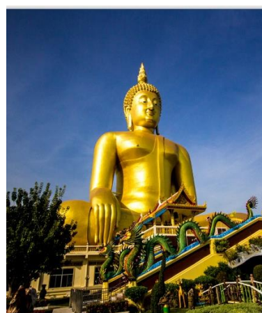
ภาพที่ 4 พระใหญ่วัดม่วงชุม วัดพิบูลทอง วัดพระนอนจ๊กสีห์ จ.สิงห์บุรี และวัดม่วง จ.อ่างทอง เส้นทางท่องเที่ยวเชิงศาสนาที่อยู่ในแผนการท่องเที่ยวพระใหญ่ โดยสัมพันธ์กับระบบตลาดชุมชนในแต่ละวัด

3.การส่งเสริมระบบเศรษฐกิจผ่านการค้าชุมชน หมายถึง เมื่อมีนักท่องเที่ยวเข้ามาในวัด ทำให้เกิดการซื้อขาย มีการจัดทำตลาดเพื่อรองรับการท่องเที่ยว ทำให้คนในชุมชนมีอาชีพ มีรายได้ มีเม็ดเงินเข้ามา