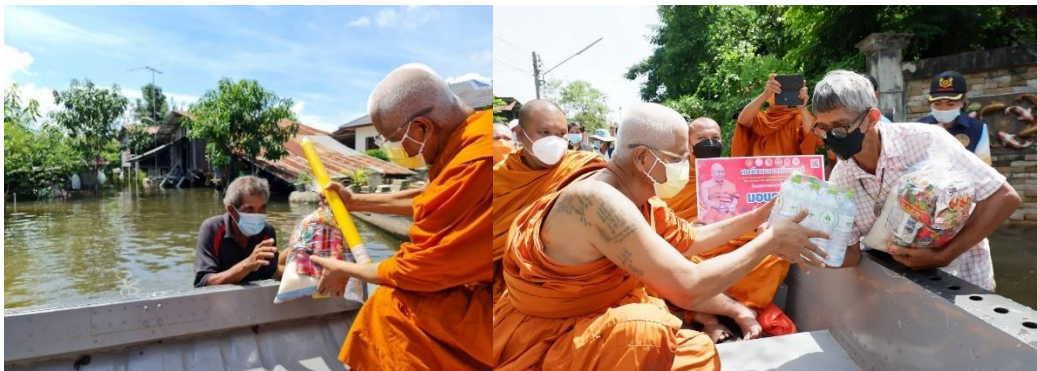
ภาพที่ 4 เครือข่ายพระสงฆ์กับการช่วยเหลือสังคม ที่ อ.พิมาย จ.นครราชสีมา ในการให้การบรรเทาสาธารณภัยเบื้องต้น เมื่อ 4 ตุลาคม 2564 (ภาพวัดอินทาราม จ.สมุทรสงคราม 4 ตุลาคม 2564)

จากภาพข่าวในเขตหลายพื้นที่ จะพบเห็นพระสงฆ์ได้ออกมาทำงานสาธารณสงเคราะห์ให้ความช่วยเหลือประชาชนในหลากพื้นที่ ในพื้นที่น้ำท่วมในปี 2564 ในฐานะที่พระสงฆ์เป็นเจ้าของพื้นที่ โดยขั้นแรกให้ความช่วยเหลือโดยใช้วัดเป็นที่พักอาศัย เป็นที่รับบริจาคให้ความช่วยเหลือ รวมไปถึงเป็นหน่วยประสานงานจากภาคีภายนอกในการให้ความช่วยเหลือ ดังกรณีในเขตจังหวัดสุโขทัย พิษณุโลก พิจิตร นครสวรรค์ ชัยนาท สิงห์บุรี ลพบุรี อ่างทอง พระนครศรีอยุธยา รวมทั้งในชัยภูมิ และนครราชสีมา ดังนั้นบทบาทของพระสงฆ์ยังคงมีความสำคัญ และเป็นความจำเป็นภายใต้สังคมไทยและวิถีพุทธ ที่มีวัดเป็นฐานของชุมชนในการทำงานร่วมกันระหว่างพระสงฆ์และชาวบ้าน พระสงฆ์ได้ทำบทบาทในเชิงของการสงเคราะห์ในแบบสาธารณสงเคราะห์หรือการบรรเทาในเบื้องต้น เช่นการเยี่ยมให้กำลังใจ การช่วยเหลือเป็นเครื่องอุปโภค บริโภคเป็นเบื้องต้น ซึ่งจะทำให้เกิดการขับเคลื่อนการดำเนินชีวิตไปได้ในเบื้องต้น ต่อสภาพที่เกิดขึ้นของน้ำท่วม ซึ่งสอดคล้องกับงานศึกษาของ พระครูอาทรกิจจาภิรักษ์ และคณะ (2563) ในเรื่อง บทบาทพระสงฆ์กับงานสาธารณสงเคราะห์ หรือในงานของวิจัย สืบพงษ์ ธรรมชาติ,พระครูอรุณสิงหธรรม (2558) เรื่อง ศึกษาบทบาทพระสงฆ์ในการพัฒนาสังคมตามแนวพระพุทธศาสนา : กรณีศึกษาพระครูประภักขรธรรมวิธาน (มิ่ง ปภสฺสโร) รวมทั้งในงานวิจัยของ พระครูปริยัติกิจจาภิวัฒน์ (2558) เรื่อง ภาวะผู้นำกับการจัดการประสิทธิภาพงานสาธารณสงเคราะห์ ที่ในงานวิจัยสะท้อนแนวคิดในเรื่องพระสงฆ์ต้องบำเพ็ญประโยชน์เพื่อสังคมส่วนรวม ตามพันธกิจและหน้าที่ของพระสงฆ์เพื่อส่วนรวม นับเป็นบทบาทในฐานะพระสงฆ์ ในฐานะที่เป็นที่พึ่งของสังคมและประชาชน ทำให้เกิดการช่วยเหลือซึ่งกันและกันได้