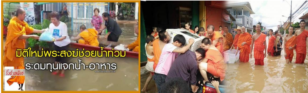
ภาพที่ 5 พระสงฆ์สกลนคร (2560) และน่าน (2559) ในสถานการณ์น้ำท่วมในประเทศไทย (เดลินิวส์ออนไลน์,2560;ทีวีพูลออนไลน์,2559)

จากภาพ 2-5 บทบาทของพระสงฆ์จึงเป็นลักษณะร่วมในการทำงานเพื่อสงเคราะห์ประชาชนภายใต้แนวคิด พระต้องทำประโยชน์ เพื่อส่วนรวม พระสงฆ์ต้องช่วยเหลือสังคมและส่วนรวมภายใต้สถานการณ์ที่ยากลำบาก โดยเฉพาะน้ำท่วมที่เกิดขึ้นอย่างต่อเนื่องในหลายพื้นที่และในหลายเขตจังหวัดทั้งในปัจจุบัน และที่ผ่านมา เราจึงเห็นภาพข่าวพระสงฆ์ กับการมีส่วนร่วมกับสังคมชุมชนในการบรรเทาหรือให้ความช่วยเหลือในเบื้องต้นเพื่อส่งเสริมคุณภาพชีวิตและช่วยเหลือประชาชนในสถานการณ์ที่ยากลำบากได้ โดยมีกำลังคน ทุนทางสังคมในการช่วยเหลือซึ่งกันและให้เกิดความช่วยเหลือเป็นเบื้องต้นได้