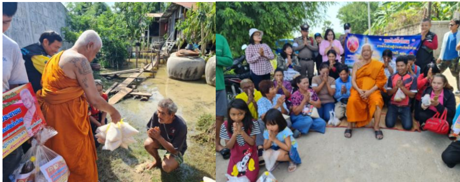
ภาพที่ 2 เครือข่ายพระสงฆ์กับการช่วยเหลือสังคม ที่ อ.พิมาย จ.นครราชสีมา ให้การบรรเทาสาธารณภัย เบื้องต้น เมื่อ 24 ตุลาคม 2563 (ภาพวัดอินทาราม จ.สมุทรสงคราม)