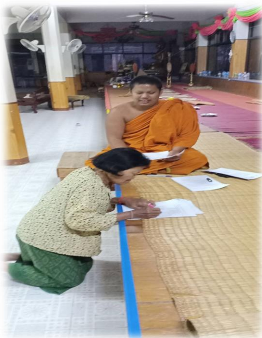
เก็บแบบสอบถามประชาชนตำบลท่าเยี่ยม