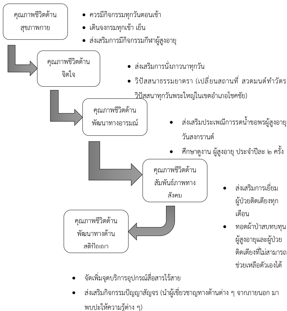
แผนภาพที่ ๔.๒ องค์ความรู้ที่ได้จากการสังเคราะห์งานวิจัย

องค์ความรู้ที่ได้จากการสังเคราะห์งานวิจัย เรื่อง บทบาทของพระสงฆ์ที่มีต่อการส่งเสริมคุณภาพชีวิตผู้สูงอายุใน อำเภอโชคชัย จังหวัดนครราชสีมา ทำให้ผู้วิจัยได้ค้นพบองค์ความรู้ใหม่ที่สามารถนำไปใช้ประโยชน์ได้ตามแผนภาพที่ ๔.๒