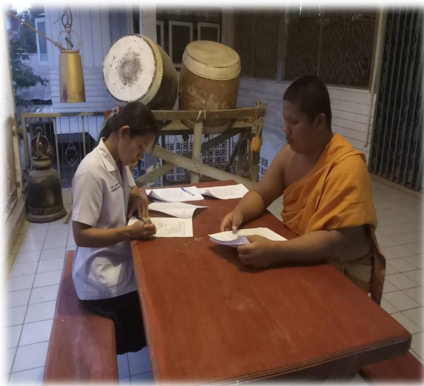
เก็บแบบสอบถามประชาชนตำบลท่าอ่าง