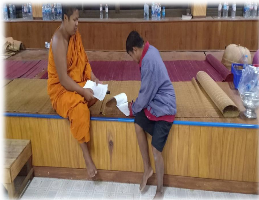
เก็บแบบสอบถามประชาชนตำบลกระโทก