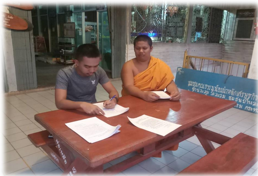
เก็บแบบสอบถามประชาชนตำบลท่าลาดขาว