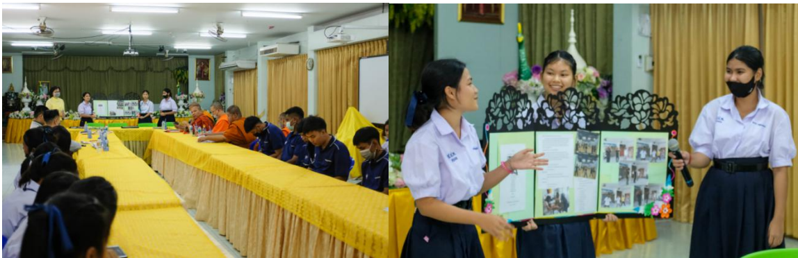
ภาพที่ 1 นักเรียนนำเสนอกิจกรรมต่อคณะกรรมการผู้ทรงคุณวุฒิ คณะนักวิจัย ภายใต้กรอบคตินักเรียนทำได้ เป็นความสร้างสรรค์ของนักเรียนสู่ชุมชนสร้างสรรค์ (ภาพคณะนักวิจัย : 7 ตุลาคม 2563)

ที่มา : แบบฟอร์มรายงานความก้าวหน้ากิจกรรม โครงการฝึกอบรมศักยภาพเยาวชนในการออกแบบอนาคตชุมชนสร้างสรรค์ (เมื่อ : 7 ตุลาคม 2563)