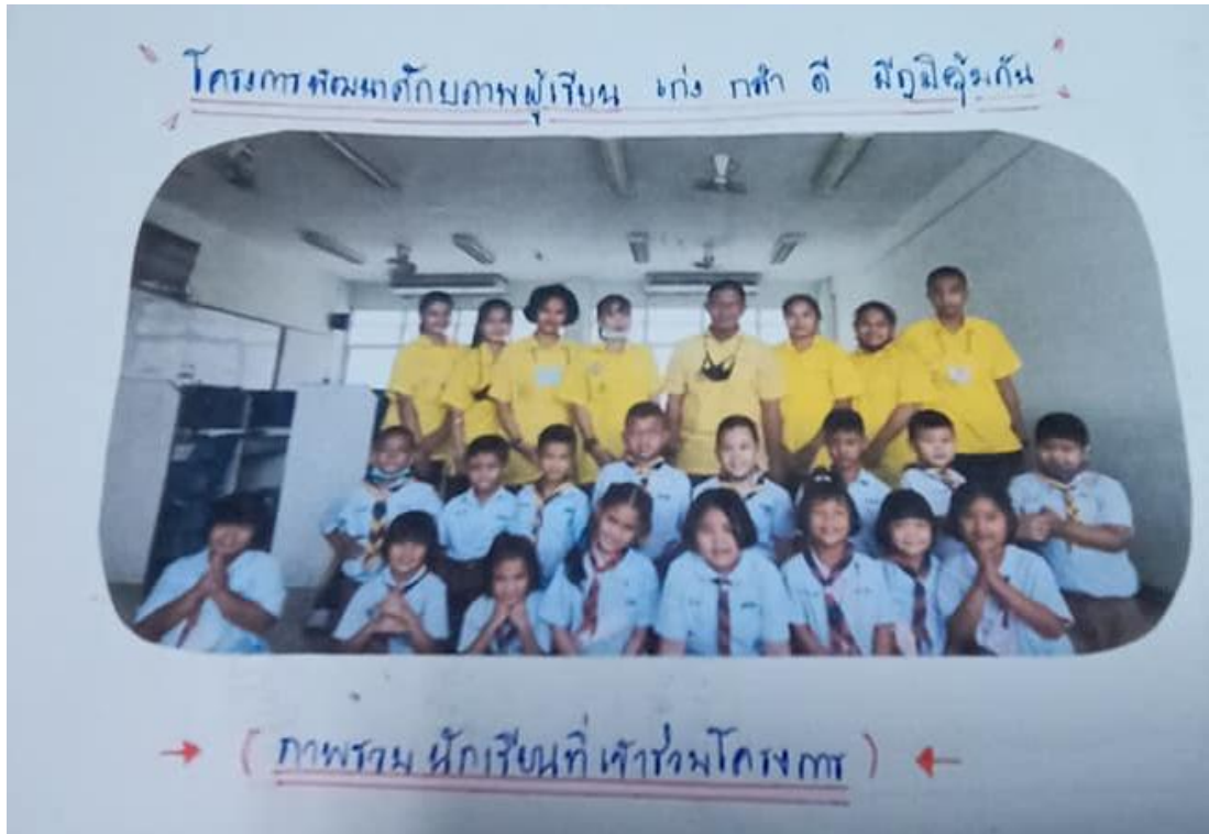
ภาพที่ 7 โครงการพัฒนาศักยภาพนักเรียน เก่ง กล้า ดี มีภูมิคุ้มกัน (ภาพจากแบบฟอร์มรายงานความก้าวหน้ากิจกรรม : 7 ตุลาคม 2563)