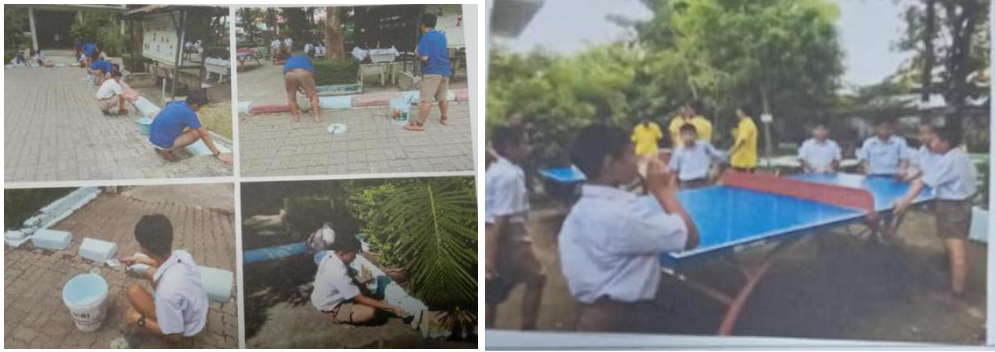
ภาพที่ 5 รายงานผลการดำเนินการของนักเรียน ที่สะท้อนถึงการคิดอย่างเป็นระบบสู่การลงมือดำเนินการ อย่างเป็นระบบเป็นขั้นตอน (ภาพจากแบบฟอร์มรายงานความก้าวหน้ากิจกรรม: 7 ตุลาคม 2563)

2.การฝึกปฏิบัติการอย่างเป็นระบบ กระบวนการส่งเสริมความคิดสร้างสรรค์ของเด็ก สู่การสร้างสรรค ชุมชน เริ่มตั้งแต่การคิด การเขียนโครงการ การดำเนินการ และการรายงานผล แม้สถานการณ์ระหว่าง กรกฎาคม-ตุลาคม 2563 ภายใต้สถานการณ์โควิด 19 แพร่ระบาดทำให้ต้องมีมาตรการเว้นระยะห่างทาง สังคม และมาตรการเฝ้าระวัง ซึ่งจำกัดวงให้นักเรียนทำกิจกรรมในชุมชนใกล้โรงเรียนหรือในโรงเรียน แต่สิ่งที่ พบ ผ่านเอกสารบันทึกกิจกรรมทำให้เห็นว่านักเรียนมีขั้นตอนการ นับแต่การเขียนโครงการร่วมกับครูที่ปรึกษา ทำงานเป็นขั้นตอนตามที่กำหนดไว้ วิธีการแก้ปัญหาเฉพาะหน้าในกิจกรรม ที่เกิดขึ้นในสถานการณ์โควิด 19 จากผลสะท้อนคิด ทำให้เห็นว่านักเรียนมีความคิด พร้อมลงมือปฏิบัติเชิงระบบอย่างเป็นขั้นตอนภายใต้กรอบ ของการคิดอย่างสร้างสรรค์ รวมทั้งแก้ปัญหาเฉพาะหน้าในภาวะเสี่ยงได้ด้วย ซึ่งวิธีการดังกล่าวปรากฏเป็นผล ในงานวิจัยเรื่อง การศึกษาและพัฒนาข้อเสนอเพื่อส่งเสริมให้ท้องถิ่นสนับสนุนสภาเด็กและเยาวชนริเริ่ม ทำกิจกรรมสร้างสรรค์และแก้ไขปัญหาในชุมชนสังคมของตนเอง (ชานนท์ โกมลมาลย์ อนุพงษ์ จันทะแจ่ม โชติเวชญ์ อึ้งเกลี้ยง นดา แวญโซะ,2562,62-101) หรือในงานวิจัยเรื่อง การเสริมสร้างศักยภาพเด็กและ เยาวชนโดยการมีส่วนร่วมของชุมชนในพื้นที่กิ่งเมืองกิ่งชนบท : กรณีศึกษาบ้านด้ามพริ้ว ตำบลขามใหญ่ อำเภอเมือง จังหวัดอุบลราชธานี (ชูพัทธ์ สุทธิสา,ชุตินา จันทรมณี,อินทรา ชาฮีร์,2555,217-236) โดยใน งานวิจัยให้ผลที่ใกล้เคียงและสอดคล้องกัน ตามที่ปรากฏในผลการบันทึกและการรายงานผลการดำเนินงาน ของนักเรียนที่โรงเรียนชุมชนป้อมเพชรด้วยเช่นกัน