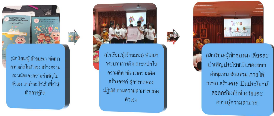
ภาพที่ 3 การสะท้อนคิดประสบการณ์ตรงของนักเรียนจากการปฏิบัติในกิจกรรมโครงการ (ภาพคณะนักวิจัย : 7 ตุลาคม 2564)

นอกจากข้อมูลของวิทยากร นักวิจัย ผู้บริหารสถานศึกษา นักเรียนผู้ร่วมโครงการ ผู้ทรงคุณวุฒิที่เข้าร่วม เป็นกรรมการประเมินโครงการของนักเรียน จากการสัมภาษณ์และสะท้อนคิดถึงผลได้เชิงประจักษ์ต่อนักเรียน หรือเด็กผู้เข้าร่วมดำเนินกิจกรรมโครง ซึ่งสามารถประมวลผลได้ คือ