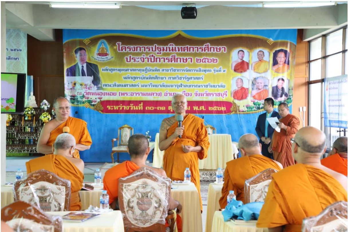
กิจกรรมคณาจารย์-นิสิตสัมพันธ์ โดยคณาจารย์ประจำหลักสูตร/นิสิตรุ่นพี่พบนิสิตรุ่นน้อง