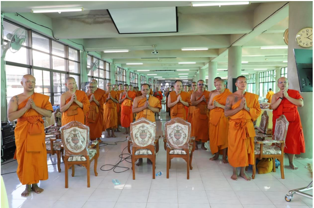
กิจกรรมคณาจารย์-นิสิตสัมพันธ์ โดยคณาจารย์ประจำหลักสูตร/นิสิตรุ่นพี่พบนิสิตรุ่นน้อง