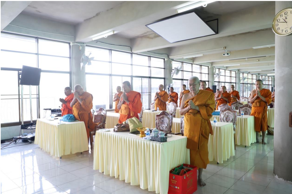
พระราชวัลภาจารย์ วิ. เจ้าอาวาสวัดหนองหอย เจ้าคณะอำเภอเมืองราชบุรี กล่าวนำบูชาพระรัตนตรัย และกล่าวต้อนรับ