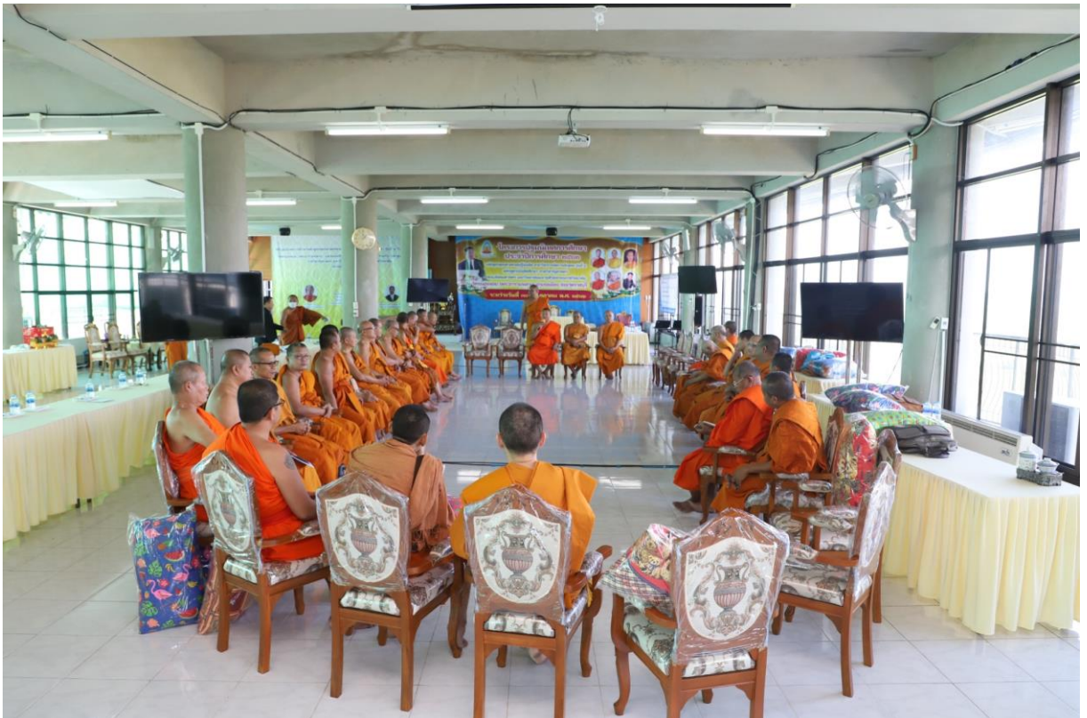
กิจกรรมคณาจารย์-นิสิตสัมพันธ์ โดยคณาจารย์ประจำหลักสูตร/นิสิตรุ่นพี่พบนิสิตรุ่นน้อง