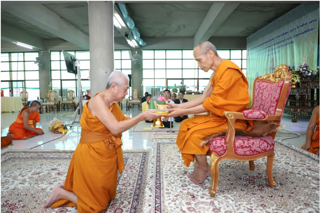
พระราชวัลภาจารย์ วิ. เจ้าอาวาสวัดหนองหอย ถวายสักการะประธานในพิธี