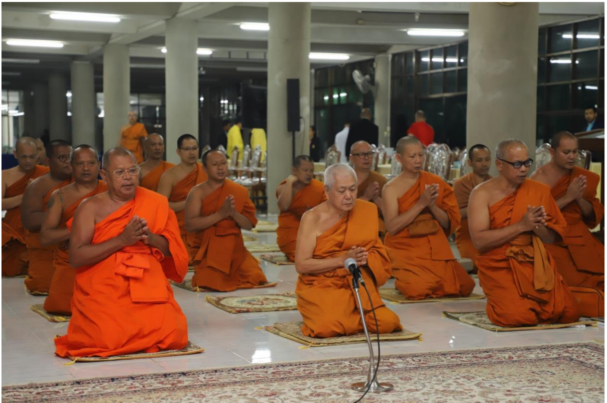
ทำวัตรสวดมนต์เจริญจิตภาวนาปฏิบัติวิปัสสนากรรมฐาน ณ ศาลาอเนกประสงค์