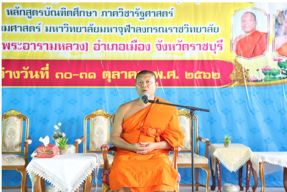
พระอุดมสิทธินายก, ผศ.ดร. รองคณบดีคณะสังคมศาสตร์ฝ่ายบริหาร/ ผอ.หลักสูตรพุทธศาสตรดุษฎีบัณฑิต สาขาวิชาการจัดการเชิงพุทธ กล่าวให้ข้อคิดเห็นในการศึกษาแก่นิสิตใหม่