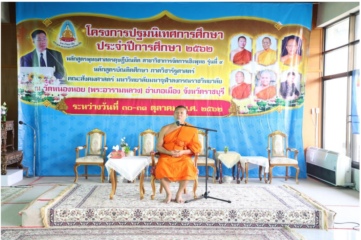
พระอุดมสิทธินายก, ผศ.ดร. รองคณบดีคณะสังคมศาสตร์ฝ่ายบริหาร ประธานในพิธีกล่าวปิดโครงการ