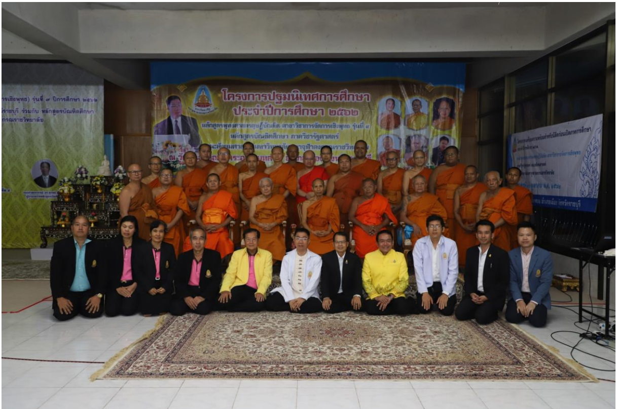
ถ่ายรูปหมู่ร่วมกัน