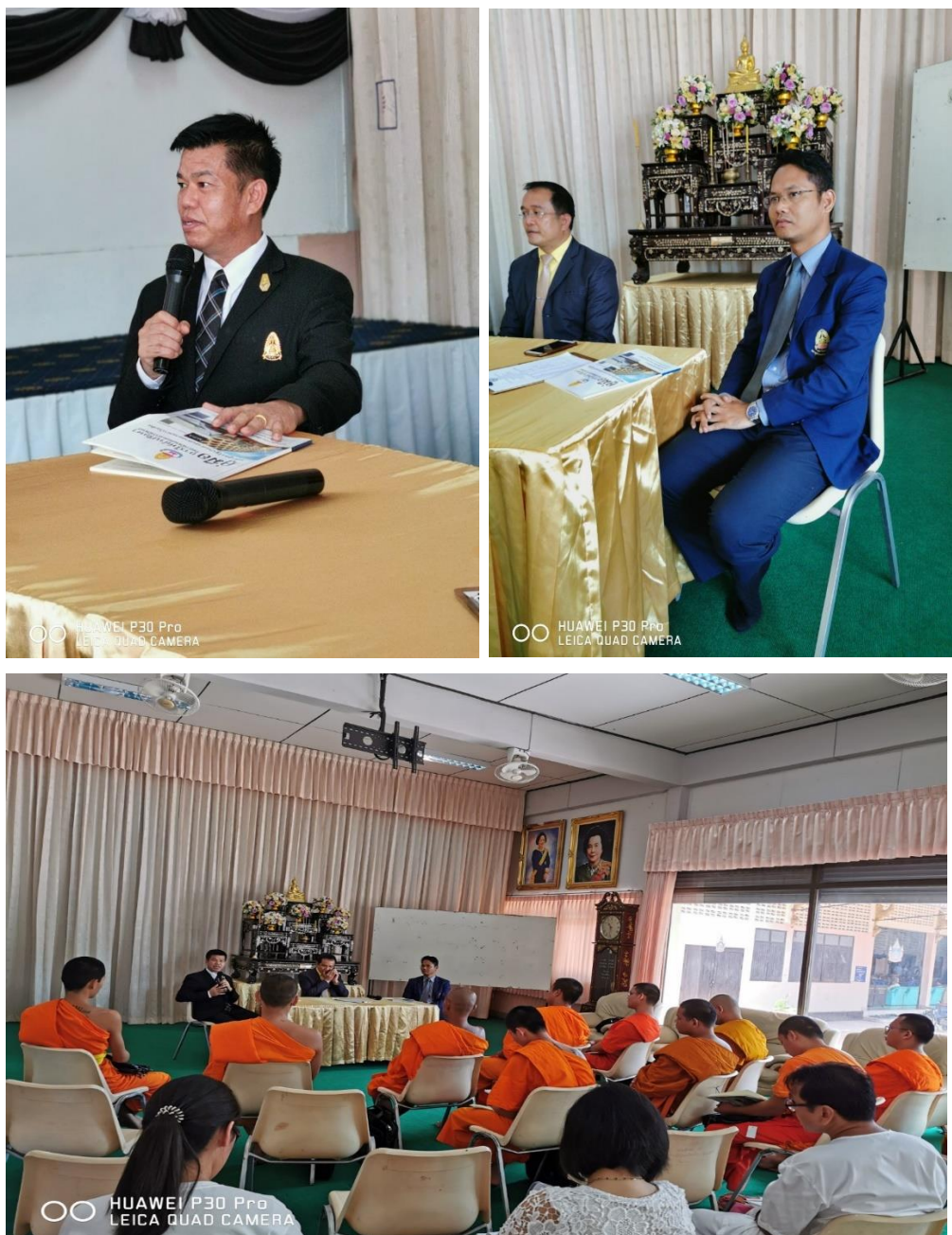
รูปภาพประกอบกิจกรรม โครงการเตรียมความพร้อมสำหรับนิสิตก่อนเปิดภาคการศึกษา ระดับปริญญาโท ประจำปีการศึกษา ๒๕๖๒