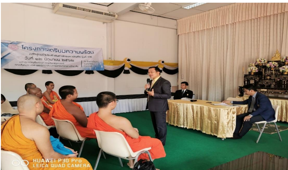
รูปภาพประกอบกิจกรรม โครงการเตรียมความพร้อมสำหรับนิสิตก่อนเปิดภาคการศึกษา ระดับปริญญาโท ประจำปีการศึกษา ๒๕๖๒