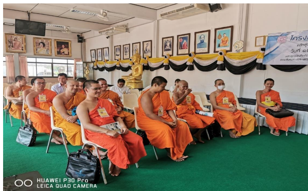
รูปภาพประกอบกิจกรรม โครงการเตรียมความพร้อมสำหรับนิสิตก่อนเปิดภาคการศึกษา ระดับปริญญาโท ประจำปีการศึกษา ๒๕๖๒