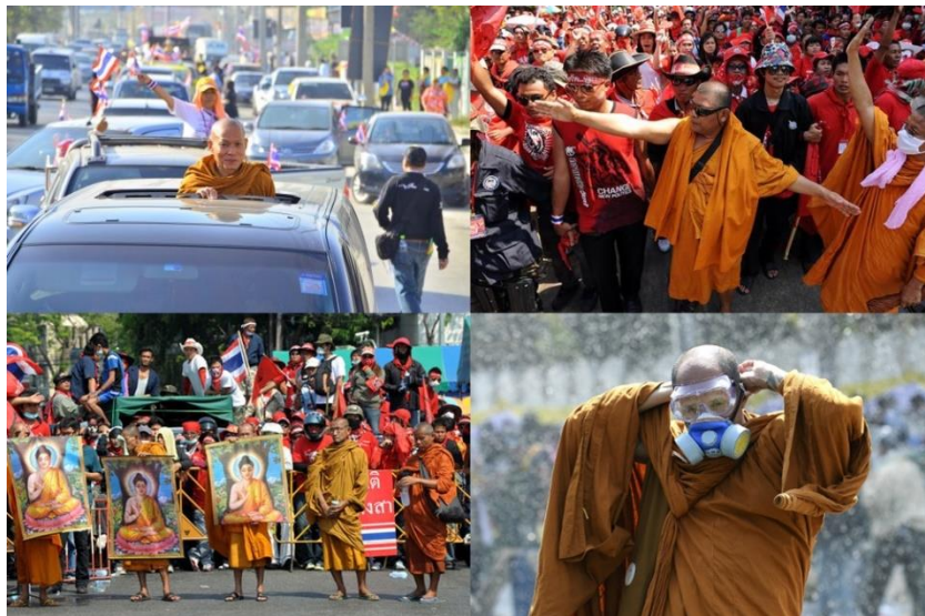
ภาพประกอบ 4 พระสงฆ์กับการมีส่วนร่วมทางการเมืองในอดีต ในฐานะมีส่วนร่วมทางความคิด ชี้นำ และ เป็นผู้นำในการเข้าร่วมชุมนุมทางการเมือง

หลักฐานว่าพระสงฆ์ฝ่ายต่อต้านจะถูกกำกับ หรือกำจัดโดยรัฐหรือการเมือง