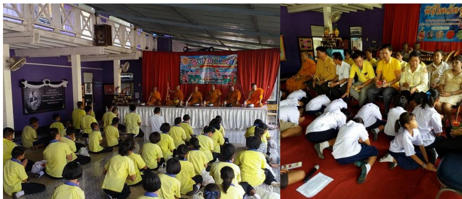
ภาพประกอบ 3 วัดหนองตาบุญกับผลจากศาสตร์ของการทำนาย นำไปสู่การสนับสนุนส่งเสริมการศึกษา และเยาวชน ผ่านการให้คำสอน แนะนำ พาทำกิจกรรมทางศาสนา และอุปถัมภ์การศึกษา (ภาพ ออนไลน์, เข้าถึงเมื่อ 22 ธันวาคม 2560)

ในแง่ของการส่งเสริมให้พระภิกษุ และชาวพุทธรับและยืนยันยอมรับว่าเป็นส่วนหนึ่งของพระพุทธศาสนาคงไม่ใช่ แต่ถ้าในกรณีผิดศีล แต่ไม่ผิดธรรมมองไปที่เจตนารมณ์เพื่อการบริหาร เป็นเครื่องมือ “เปลี่ยน” ให้คนไปหาแก่นที่ย่อมจะเป็นประโยชน์ ในแบบ “โลก” ที่น้อยหนึ่งเป็นเครื่องมือ ในการตัดสินใจ นัยหนึ่งเพื่อเป็นเครื่องมือในการบริหารจัดการ เป็นกระบวนการทางจิตวิทยาหรือการสร้างสิ่งเชื่อให้เป็นจุดร่วมต่อการกำกับ ควบคุม หรือควบคุมต่อกระบวนการทางความเชื่ออื่น ๆ ในสังคม