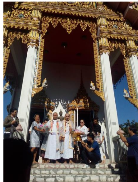
ภาพประกอบ 2 เสนาสนะ ถาวรวัตถุในพระพุทธศาสนาของวัดหนองตาบุญ จ.สระบุรี กับความศรัทธา และ การใช้ศาสตร์แห่งการทำนายเป็นเครื่องมือในการให้การบริการสังคม บริหารจัดการวัด และเผยแผ่พระพุทธศาสนา (ภาพ ออนไลน์, เข้าถึงเมื่อ 22 ธันวาคม 2560)

ดังนั้นภารกิจของวัดหนองตาบุญ จ.สระบุรี จึงมีความหมายเป็นการสร้างความมั่นใจในการตัดสินใจ นำไปใช้บริหารชีวิต บริหารกิจการและประสบการณ์ที่เกิดขึ้นนัยหนึ่ง “ บริหารตน-บริหารคน-บริหารงาน ” ศาสตร์ในการให้คำปรึกษาทำนาย เพื่อการบริหารตนของผู้มาขอคำปรึกษา บริหารคนที่เกี่ยวข้องในแต่ละระดับชั้น และบริหารงานที่เป็นภาระงานของผู้มาขอคำปรึกษารวมไปถึงบริหารองค์กรที่เนื่องด้วยคนที่มาขอคำปรึกษาทำหน้าที่ในการบริหาร