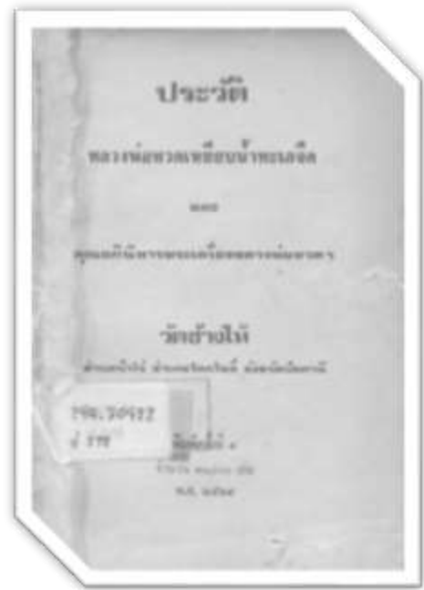
ภาพที่ 2 หนังสือรวบรวมประวัติหลวงปู่ทวดโดยวัดช้างไห้ในยุคแรก ๆ