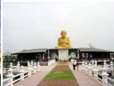
ภาพที่ 3 ภาพการก่อสร้างหลวงปู่ทวดองค์ใหญ่ ในประเทศไทย (วัดห้วยมงคล จ.ประจวบ,อุทยานหลวงปู่ทวด จ.พระนครศรีอยุธยา) เครื่องมือนับถือความเชื่อศรัทธาในหลวงปู่ทวดในกลุ่มชาวพุทธในประเทศมาเลเซีย สิงคโปร์ และอินโดนีเซีย

(3) จากวัตรปฏิบัติของหลวงปู่ทวดสู่ความเชื่อศรัทธาเลื่อมใสในปฏิบัติของหลวงปู่ทวด ทำให้เห็นว่าในข้อเท็จจริงที่เกิดขึ้นได้ส่งผลเป็นวัตรปฏิบัติและข้อปฏิบัติที่ชัดเจนมากขึ้น เส้นทางเกิดจากความเชื่อ สู่การนำพาโดยพระสงฆ์ชาวไทย ในการนำวัตถุมงคลไปยังสถานที่ต่าง ๆ ในประเทศสิงคโปร์ มาเลเซีย และอินโดนีเซีย พร้อมแนะนำประวัติความเป็นมาจึง