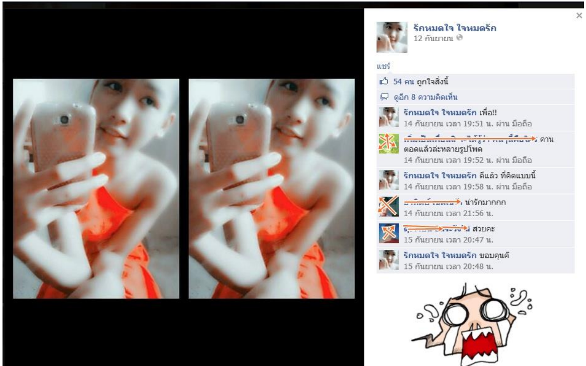
ภาพที่ 2 ภาพตัวตนที่สะท้อนพฤติกรรมทางเพศ ผ่านโลกออนไลน์ โดยเฉพาะ Facebook ที่นิยมหนึ่งสะท้อนภาพตัวตนทางเพศรส กับความเชื่อทางศาสนากับสิ่งที่เป็นและชุด “กาสาวะ” ที่สวมใส่