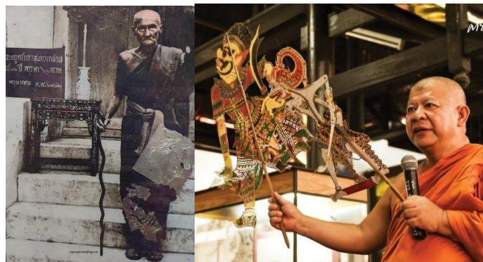
ภาพที่ 2 ผู้ริเริ่มหนังใหญ่วัดขนอน "หลวงปู่กล่อม" หรือพระครูศรีทาสุนทร และอนุรักษ์สืบสานโดยพระครูพิทักษ์ศิลปาคม

ในการอนุรักษ์มรดกทางวัฒนธรรมหนังใหญ่ในฐานะเป็นภูมิปัญญา เป็นมรดกของช่วงเวลา และเป็นคุณค่าในเรื่องการแสดงในอดีต อาจทำให้เห็นว่าหนังใหญ่ มหรสพเก่าแก่นำมาจากประเทศอินเดีย เป็นต้นแบบของการเล่นโขนในปัจจุบัน เข้ามาในไทยตั้งแต่สมัยอาณาจักรศรีวิชัย ตัวหนังใหญ่แกะสลักจากหนังวัว หรือหนังควาย นำมาฉลุเป็นรูปตัวละครเรื่อง "รามเกียรติ์" จากหนังที่มีตัวละครเล็ก ๆ ได้เพิ่มปราสาท ราชวัง ต้นไม้ ป่า เข้าไปอีก เพื่อให้สามารถเล่นจบภายในตอนเดียว จึงทำให้แผ่นหนังใหญ่ขึ้นมาก จึงเรียกว่า "หนังใหญ่" กระทั่งเผยแพร่สู่พระราชสำนักของไทย เมื่อปี พ.ศ. 2001 ประมาณ 500 กว่าปีมาแล้ว ตรงกับรัชสมัยของสมเด็จพระบรมไตรโลกนาถ (พ.ศ.1991/1448-2031/1488) สมัยกรุงศรีอยุธยา แล้วก็เป็นที่นิยมของคนชั้นสูง เล่นในงานของพระมหากษัตริย์ เช่น งานฉลองพระราชสมภพ ก่อนจะมาสู่ชาวบ้าน ชุมชน เป็นต้น ในส่วนของ "วัดขนอน" ก็เป็นชุมชนหนึ่งที่ได้รับการเผยแพร่มาในสมัยรัชกาลที่ 5 โดยผู้ที่ริเริ่มในสมัยนั้นคือ "หลวงปู่กล่อม" หรือพระครูศรีทาสุนทร (พ.ศ.2391/1848-2485/1942 อายุ 94 ปี 72 พรรษา) โดย "หนังใหญ่" ชุดแรกคือ ชุดหนุมานถวายแหวน ปัจจุบันสร้างรวมทั้งหมด 9 ชุด 313 ตัว ซึ่งถือว่าเป็นสมบัติของวัดที่ได้รับความเสียหายและสืบทอดเนื่องมาจากจนกระทั่งปัจจุบัน