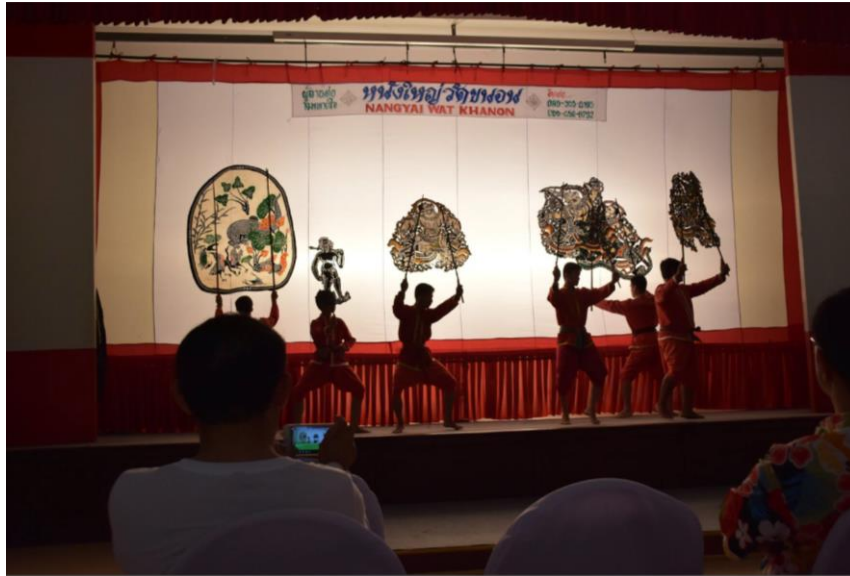
ภาพที่ 1 การเชิดหนังใหญ่ที่วัดขนอน