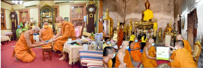
ภาพที่ 3 สมเด็จพระอริยวงศาคตญาณ สมเด็จพระสังฆราช สกลมหาสังฆปริณายก ประทานสิ่งของพร้อมปัจจัยแก่วัดอินทาราม โดยมอบให้ สมเด็จพระมหาธีรวงศ์ เลขานุการสมเด็จพระสังฆราชเป็นผู้มอบสิ่งของพร้อมปัจจัยเพื่อนำไปช่วยเหลือผู้ที่ได้รับผลกระทบจากสถานการณ์การแพร่ระบาดของไวรัส โควโรนา 2019 (COVID-19) (ภาพ : วัดอินทาราม, 29 เมษายน 2563)

สมเด็จพระสังฆราชมอบข้าวสารมา 100 ถุง ก็นำไปแจกต่อให้กับวัดที่ตั้งโรงงาน แล้วก็บอกว่ามาให้กำลัง น่าดีใจ ไปบางวัด พอประกาศออกไป มีข้าวสารกว่า 1 พันถุงมารอไว้แล้ว ถ้าคิดถุงละ 100 บาท ก็ 1 แสนแล้ว เพราะฉะนั้นมีที่ มีทุน มีทีม มีความอดทน มีทำ (ลงมือทำจริง/ธรรม) พระสงฆ์ต้องทำงานเป็นทีม ข้าแก่คนเดียว ข้ายิ่งใหญ่คนเดียว ข้างตั้งคนเดียว ต้องทำงานเป็นทีม ต้องแบ่งงานกันทำ ต้องใช้คนให้ถูกกับงานด้วย