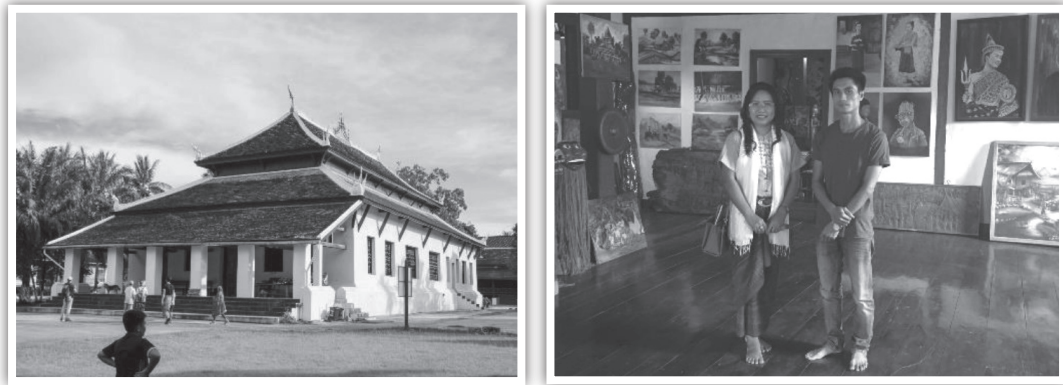
ภาพที่ 5 วัดวิสุนราช (ซ้าย) อันเป็นที่ตั้งของพระธาตุหมากโม ซึ่งเป็นสถานที่สำคัญทางศาสนาและถูกออกแบบให้เป็นแหล่งท่องเที่ยวทางศาสนา (ขวา) ศิลปกรรม หอศิลป์ กับการท่องเที่ยวในหลวงพระบาง (ภาพคณะนักวิจัย: 12-15 กรกฎาคม 2561)

การท่องเที่ยวที่ปรากฏในหลวงพระบาง สปป. ลาว เป็นการจัดการท่องเที่ยวอันเกี่ยวข้องกับศาสนา วัด และสถานที่สำคัญทางศาสนา สามารถจำแนกเป็นองค์ความรู้ได้ ดังนี้