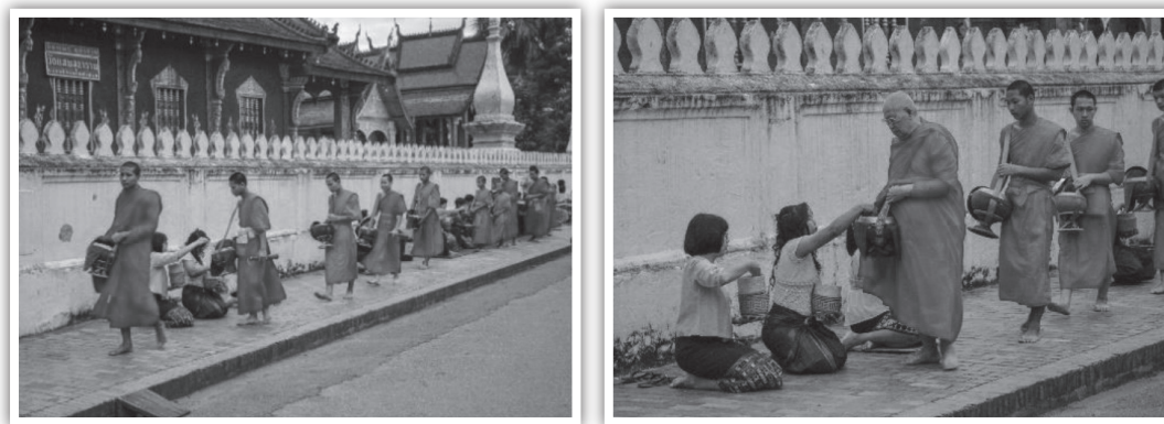
ภาพที่ 7 (ขวา-ซ้าย) การตักบาตรพระเช้าภาพวัฒนธรรมทางศาสนาของหลวงพระบางที่ถูกออกแบบเป็นการท่องเที่ยวเชิงวัฒนธรรม (ภาพคณะนักวิจัย 12-15 กรกฎาคม 2561)

5) การจัดการท่องเที่ยวที่ต้องพัฒนาไปสู่ความรู้และเจตนารมณ์ของศาสนา หมายถึง การท่องเที่ยวทางวัฒนธรรมและศาสนา ควรมีการส่งเสริมความรู้ที่ถูกต้องและเจตนารมณ์ทางศาสนา ดังกรณีการใส่บาตรพระเช้าที่เป็นภาพจำของชาวโลก ควรต้องสื่อไปถึงเจตนารมณ์ของการเสียสละ แบ่งปัน เพื่อสะท้อนคิดให้ชาวโลกว่าการให้หมายถึงการหยิบบ้างแบ่งปันตามคติในทางพระพุทธศาสนา การสะท้อนคิดผ่านความสงบของความเป็นเมืองผ่านคติทางศาสนาในเรื่องสติ ปัญญา หรือการสะท้อนผ่านสถาปัตยกรรมทางพระพุทธศาสนาที่สะท้อนถึงความงามทางจิต (Magnificent) สู่การท่องเที่ยวอย่างมีสติ ยับยั้งชั่งใจ (Mindfulness) แลเคารพในบริบทของพื้นที่นั้นตามคติทางพระพุทธศาสนา ที่สอดคล้องกับ “Spiritual Tours” (UNWTO, 2013; John Holt, 2009) ที่ผ่านกระบวนการทางศาสนาสู่โลกการพัฒนาแสดงออกผ่านสถาปัตยกรรม หรือประเพณีอันเนื่องด้วยศีลธรรมและจารีต สะท้อนผ่านประเพณีที่มีเป้าหมายเพื่อการควบคุมจริยธรรม ทั้งในเชิงบุคคลและสังคม จนกลายเป็นจารีตโดยมีฐานคติมาจากพระพุทธศาสนา หรือความเชื่อทางศาสนา ซึ่งแนวโน้มจะทำให้เห็นคุณค่า สิ่งประดิษฐ์สร้างทั้งสถาปัตยกรรมและประเพณี ที่เนื่องด้วยการท่องเที่ยวด้วย