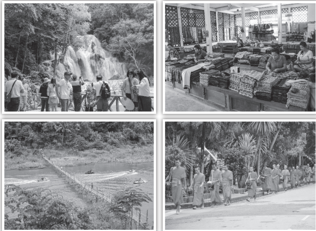
ภาพที่ 2 สภาพของการท่องเที่ยวในหลวงพระบางเมืองมรดกโลก ที่สำรวจในเบื้องต้นจะพบการท่องเที่ยววัด พิธีกรรมทางศาสนา วิถีชีวิต น้ำตก ธรรมชาติ และการดำเนินชีวิตผ่านศูนย์ศิลปหัตถกรรม เป็นต้น (ภาพขณะนักวิจัย: 12-15 กรกฎาคม 2561)