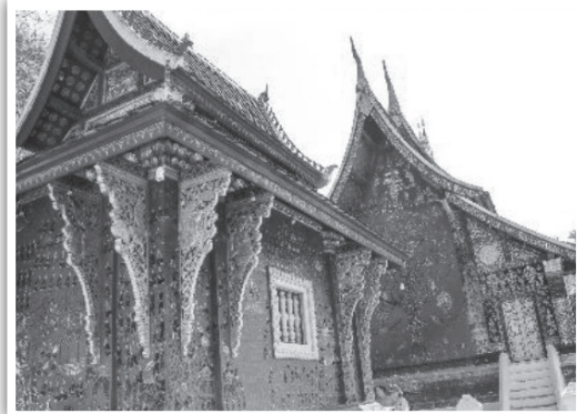
ภาพที่ 9 วิถีวัฒนธรรมทางศาสนาผ่านสถาปัตยกรรมที่ถูกออกแบบให้เป็นการท่องเที่ยว อาทิ วัดเชียงทอง วัดหนองสีคูนเมือง (ภาพคณະนักวิจัย: 12 กรกฎาคม 2561)