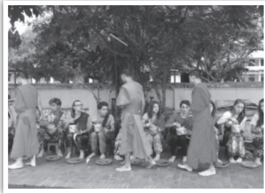
ภาพที่ 8 (ขวา-ซ้าย) วิถีวัฒนธรรมทางศาสนาที่ถูกจัดการเป้าหมายเพื่อการอนุรักษ์ รวมทั้งสะท้อนค่านิยมที่ต้องให้ความสำคัญและการแสดงออกอย่างเหมาะสม (ภาพคณະนักวิจัย, 12 กรกฎาคม 2561)