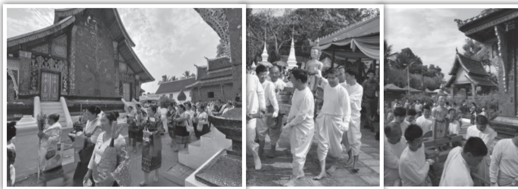
ภาพที่ 6 วัดศรีเมือง พิธีอัญเชิญพระม่านและพิธีสรงน้ำพระม่าน พระพุทธรูป ศักดิ์สิทธิ์ คู่บ้านคู่เมือง ประจำ หลวงพระบาง (ภาพ Online: 16 เมษายน 2562)

3) การจัดการท่องเที่ยวแบบวิถีจิตวิถีธรรม หมายถึง การท่องเที่ยวที่ส่งเสริมให้คนมีความสุข ภาวะที่ดี เช่น การไหว้พระ การปฏิบัติธรรม ส่งเสริมให้เกิดการไปปฏิบัติธรรมในสำนักปฏิบัติธรรม ที่มีชื่อเสียงที่มีการปฏิบัติอยู่แล้ว อาทิ วัดเชียงทอง วัดป่าโพนเพาวนาราม (Wat Pa Phon Phao) หรือวัดสุวรรณคีรี หรือวัดอื่นๆ เป็นต้น โดยมีการจัดการท่องเที่ยวที่ออกแบบการท่องเที่ยวโดยผนวก การท่องเที่ยวในแบบวิถีธรรมชาติ วัฒนธรรมแบบ “Clean Mind” เทียบเคียงกับงานวิจัยเรื่อง “รูปแบบและเครือข่ายการเรียนรู้ของแหล่งท่องเที่ยวประเภทวัดในประเทศไทย” (พระมหาสุทธิยศ อากาศโร (อบอูน), 2553) ที่เสนอผลการศึกษาว่า