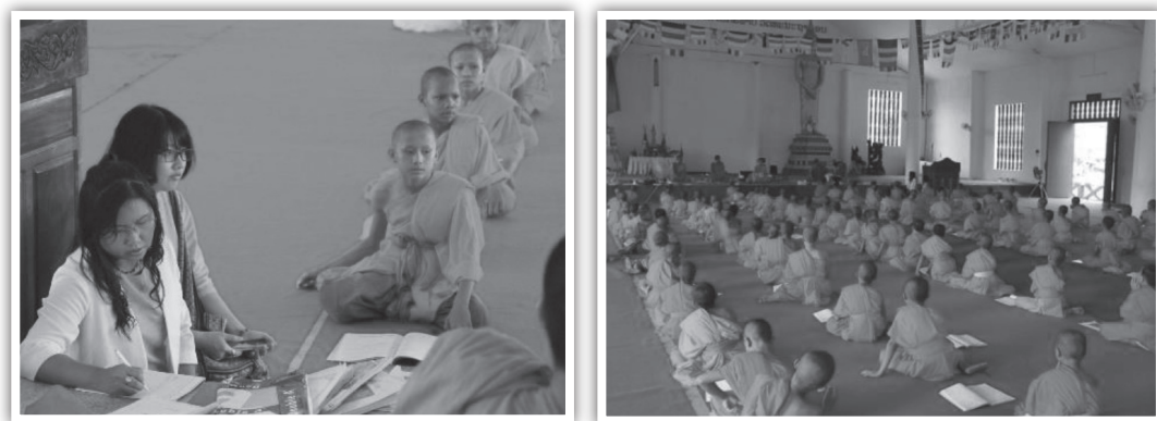
ภาพที่ 4 คณะนักวิจัยเก็บข้อมูลเกี่ยวกับการท่องเที่ยวเชิงวัฒนธรรมและศาสนาที่หลวงพระบาง (ภาพคณะนักวิจัย: 15 กรกฎาคม 2561)

การจัดการท่องเที่ยวในหลวงพระบาง เนื่องด้วยพระพุทธศาสนาและวัฒนธรรมประเพณีพระพุทธศาสนา ดังปรากฏเป็นวัด เจดีย์ พระธาตุ พระพุทธรูป และประเพณีที่เนื่องด้วยพระพุทธศาสนา ทั้งการบิณฑบาตเช้า การสรงน้ำพระในช่วงสงกรานต์ การทอดสรงหรือเถรภิเสก ประเพณีบุญต่างๆ เป็นต้น