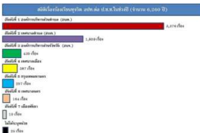
ภาพที่ 1 สถิติเรื่องร้องเรียนทุจริตต่อองค์กรปกครองส่วนท้องถิ่น

การทุจริตคอร์รัปชันในสังคมไทยได้กลายเป็นมะเร็งร้ายของระบบสังคมไทย เห็นได้จากปัจจัยและสาเหตุหลายประการ โดยเฉพาะอย่างยิ่งข้าราชการของกรมส่งเสริมการปกครองท้องถิ่น กระทรวงมหาดไทย ซึ่งเป็นกระทรวงหลักในการบริหารจัดการและบูรณาการทุกภาคส่วนเพื่อบำบัดทุกข์ บำรุงสุขประชาชน มีอำนาจหน้าที่เกี่ยวกับการรักษาความสงบเรียบร้อยของประชาชน การอำนวยความสะดวกเป็นธรรมของสังคม การส่งเสริมและการพัฒนาการเมืองการปกครอง การพัฒนาการบริหารราชการส่วนภูมิภาค การปกครองท้องถิ่น การส่งเสริมการปกครองท้องถิ่นและพัฒนาชุมชน การทะเบียนราษฎร ความมั่นคงภายในกิจการสาธารณภัย การพัฒนาเมือง และราชการอื่นตามที่มีกฎหมายกำหนด ซึ่งพันธกิจต่าง ๆ เหล่านี้ข้าราชการจะต้องปฏิบัติต่อประชาชนอย่างสุจริตธรรม แต่มีข้อมูลที่สะท้อนการทุจริตขององค์กรปกครองส่วนท้องถิ่น (อปท.) ได้รับการร้องเรียนการทุจริตมากที่สุด คือ ข้อมูลสถิติเรื่องร้องเรียนทุจริตใน 5 ปีที่ผ่านมาที่เข้ามายังคณะกรรมการป้องกันและปราบปรามการทุจริตแห่งชาติ (ป.ป.ช.) ที่มีมากถึง 3,376 เรื่อง ดังแสดงในภาพที่ 1