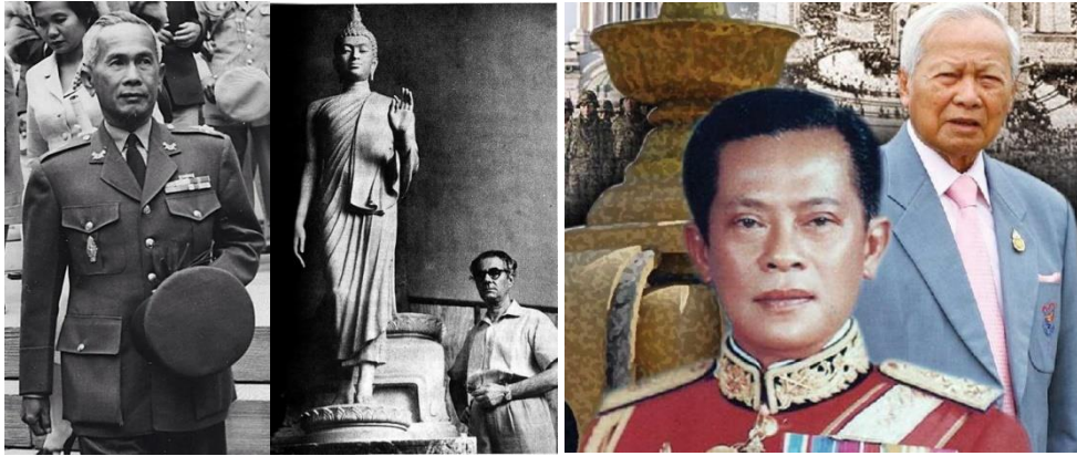
ภาพที่ 2 บุคคลที่เกี่ยวข้องกับการเริ่มต้นและสร้างพุทธมณฑล จอมพล ป.พิบูลสงคราม, พลเอกเกรียงศักดิ์ ชมะนันทน์ พลเอกเปรม ติณณสูถานนท์, และศิลปิน พีระศรี

อันหมายถึงพระธรรมคำสั่งสอนของพระองค์เท่านั้น ถ้าพูดในด้านความรู้สึกแห่งจิตใจแล้วควรเป็นแบบ Idealistic แต่อย่างไรก็ตามขอให้เป็นที่มาของศิลปินผู้ออกแบบ จะเป็นแบบไหนก็ได้ขอให้เกิดความรู้สึกก็แล้วกัน” แบบร่างของพระพุทธรูปที่ศิลปิน พีระศรี ได้ออกแบบนั้น จึงแสดงออกมาในลักษณะของ “Idealistic” หรือแบบอุดมคติ คือมีลักษณะของแบบคลาสสิกแบบกรีกโบราณ โดยพระบาทสมเด็จพระเจ้าอยู่หัวได้มีพระมหากรุณาธิคุณโปรดเกล้าฯ ให้สมเด็จพระเทพรัตนราชสุดาฯ สยามบรมราชกุมารี เสด็จประกอบพิธีสมโภช เมื่อวันที่ 21 ธันวาคม พ.ศ. 2525