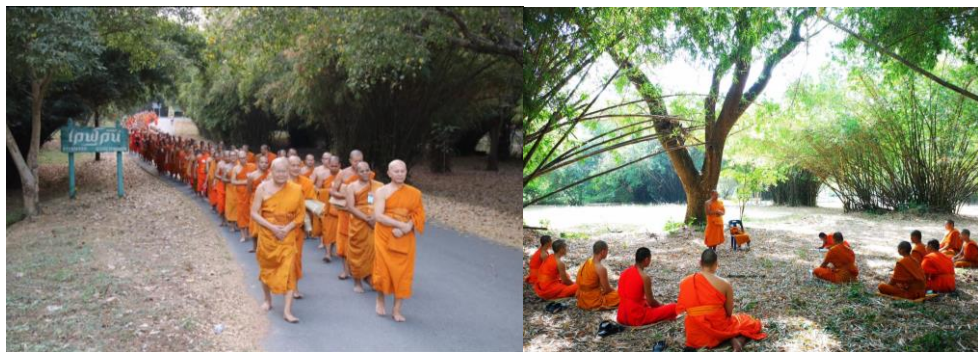
ภาพที่ 3 การปฏิบัติธรรมของนิสิตคณะสังคมศาสตร์ มจร ที่สวนเวฬุวัน ประจำปี 2562

เมืองโคลอมโบ Colombo หรือในญี่ปุ่นก็มีวัดที่ชื่อวัดโฮโคคุจิ หรือวัดสวนไผ่ (Hokokuji Temple) ดังนั้นคิดว่าด้วยไผ่ หรือเวฬุวัน วัดแห่งแรกในประวัติศาสตร์พระพุทธศาสนาจากการถวายโดยพระเจ้าพิมพิสารแต่ครั้งพุทธกาล เนื่องต่อมาเป็นคติของการสร้างวัดหรือสร้างวัดและภูมิศาสตร์ของวัดอันเนื่องด้วยไผ่ “เวฬุวัน” เพื่อเป็นพุทธานุสติ ระลึกถึงคุณของพระพุทธเจ้าในฐานะศาสดาผู้ก่อตั้งพระพุทธศาสนาและทำให้พระพุทธศาสนาเนื่องต่อมา 2500 ปีในคราวอายุพระพุทธศาสนาเท่าศักราช การเฉลิมฉลองนั้นจึงปรากฏที่พุทธมณฑลและสิ่งสร้างอันเนื่องด้วยพระพุทธศาสนาสวนเวฬุวัน ศาลาอัฐมรรค ว่าด้วยเป้าหมายหรืออุดมคติในทางพระพุทธศาสนาด้วย