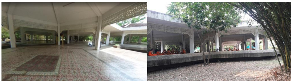
ภาพที่ 5 การปฏิบัติธรรมของนิสิตคณะสังคมศาสตร์ มจร ที่สวนเวฬุวัน (ภาพ พระมหาชาติชาย ปญญาชิโร,ป.ธ.9 : 22 ธันวาคม 2562)