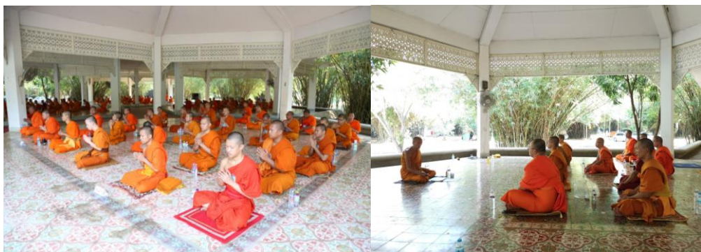
ภาพที่ 4 ศาลาอริยมรรค สถานที่สำหรับปฏิบัติธรรมของพระภิกษุและชาวพุทธ กับกิจกรรมการปฏิบัติธรรมประจำปี 2562 ของนิสิตคณะสังคมศาสตร์ มจร ที่สวนเวฬุวัน (ภาพ คณะสังคมศาสตร์ 17 ธันวาคม 2562)

โดยประมาณ อาคารทุกหลังแยกสวนกันเป็นยกพื้นสำหรับนั่ง สูงประมาณ 10-20 เซนติเมตร ที่สามารถรองรับผู้ปฏิบัติธรรมประมาณ 30-50 คนในแต่ละหลังได้ ในแต่ละหลังจะประกอบด้วยเหลี่ยมหรือมุม ทั้งหมด 6 เหลี่ยม ใช้ประกอบกิจทางศาสนา เมื่อสำรวจจากข้อมูลทางสื่อออนไลน์ มีการเข้ามาใช้ของนิสิตมหาวิทยาลัยสงฆ์เป็นเวลาหลายสิบปีต่อเนื่องกระทั่งปัจจุบัน รวมทั้งมีองค์กรทางพระพุทธศาสนาอื่น ๆ เข้ามาใช้ประโยชน์กันตามโอกาส โดยศาลาทั้ง 8 หลัง ประกอบกันรวมเรียกตามชื่อที่ปรากฏว่า ศาลามรรค 8 หรือศาลาอริยมรรค โดยลักษณะของอาคารสร้างอยู่ในสวนไผ่ (เวฬุวัน) มีเป้าหมายเพื่อการใช้ในการปฏิบัติธรรมและพระพุทธศาสนา มีเป้าหมายและประโยชน์สำหรับการสืบสานและรักษาพระพุทธศาสนา