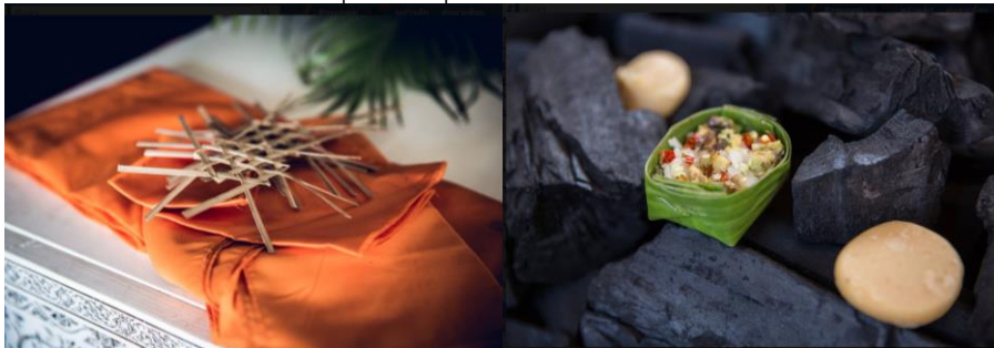
ภาพที่ 5 กระทงใส่เครื่องเซ่นก่อนฉาบงานศพ การวางตราสังข์ไม้ไผ่สาน บนไตรผ้าปิดปากโลก ทักตะนะว่าด้วยความเชื่อเกี่ยวกับความตาย (ภาพ งานศพแม่พลอย ด้วงลอย 2 ธันวาคม 2561)

3. มาตรฐาน เป็นสัญลักษณ์ของความเข้มแข็ง ถ้าไม่เข้มแข็งจะไม่สามารถก้าวเดินต่อไปได้ และไม่สามารถส่งต่อไปให้กับคนอีกรุ่นได้ด้วยเช่นกัน ความเข้มแข็ง ต้องเกิดจากใจที่เข้มแข็ง เกิดจากความพยายามอย่างแรงกล้า และเกิดจากความพร้อมในทุก ๆ ด้าน จึงเกิดการสร้างรอยประทับ ความทรงจำให้เกิดขึ้นแก่คนรุ่นสู่รุ่นได้ ดังรอยพระบาทของพระบรมศาสดาที่ถูกบูชาสำหรับศาสนานิก เพราะอย่างก้าวที่เข้มแข็ง มุ่งมั่นเพื่อส่งต่อคำสอนให้กับศาสนิก รอยเท้าของบุคคลอันเป็นที่เคารพ ก็ย่อมได้รับการสืบสานส่งต่อจากรุ่นสู่รุ่นสำหรับลูกหลานด้วยเช่นกันให้ย่างก้าวอย่างมีเหตุผล สมดุลและเป็นประโยชน์ทั้งแก่ตนเองและส่วนรวมด้วยเช่นกัน