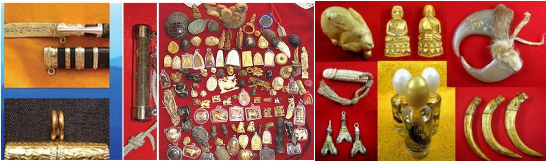
ภาพที่ 2 คิดว่าด้วยความเชื่อเรื่องเครื่องรางในสังคมไทย (ภาพออนไลน์, 12 กันยายน 2562)

“...ความเชื่อในเรื่องเครื่องรางของขลังปรากฏมีอยู่ทั่วไปในสังคมยุคบุพกาล และแอบแฝงเข้ามาอยู่ในความเชื่อและพิธีการของศาสนาที่มีลักษณะก้าวหน้าของศาสนาชั้นสูงในปัจจุบันในรูปของวัตถุบูชา เช่น การเชื่อว่าผ้ายันต์ ตะกรุด มีอำนาจศักดิ์สิทธิ์ เป็นต้น ดังนั้นความเชื่อในเรื่องเครื่องรางของขลังที่เกิดขึ้นมาพร้อม ๆ กับวิญญูณนิยมยังคงมีอิทธิพลอยู่ในความรู้สึกของมนุษย์พอ ๆ กับเรื่องวิญญูณนิยมจนกระทั่งถึงปัจจุบัน...” (ธนู แก้วโอภาส 2542,ศาสนาโลก : 38)