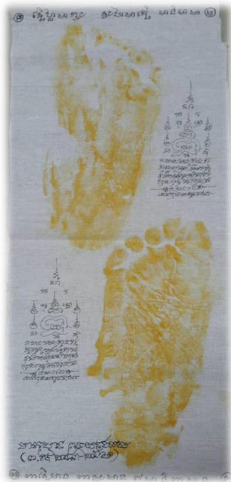
ภาพที่ 4 มาตุบาท ภาพสะท้อนความเชื่อเกี่ยวกับชีวิตหลังความตาย และการคงอยู่ต่ออัตลักษณ์ของบุคคลที่ผูกพัน ซึ่งในภาพคือมารดาของผู้เขียนที่เสียชีวิต และนำขมิ้นทาเท้าพิมพ์ปั๊มไว้เป็นเครื่องระลึก ตามคติพื้นถิ่นจังหวัดสุโขทัย