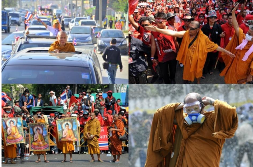
ภาพประกอบ 4 พระสงฆ์กับการมีส่วนร่วมทางการเมืองในอดีต ในฐานะมีส่วนร่วมทางความคิด ชี้นำ และ เป็นผู้นำในการเข้าร่วมชุมนุมทางการเมือง