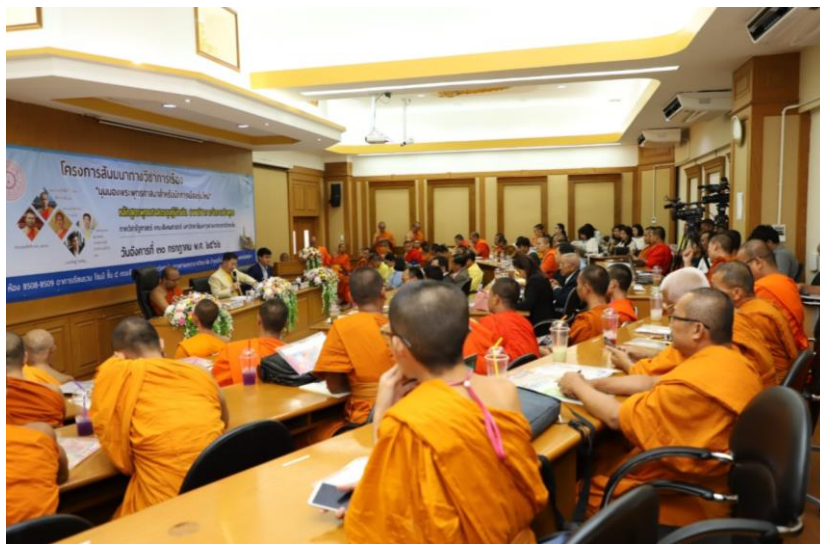
ภาพประกอบ 3 เหตุการณ์การสัมมนาทางวิชาการเรื่อง “มุมมองพระพุทธศาสนาสำหรับนักการเมืองรุ่นใหม่” หลักสูตรบัณฑิตศึกษา ภาควิชารัฐศาสตร์ คณะสังคมศาสตร์ (ภาพหลักสูตรบัณฑิตศึกษา : 30 กรกฎาคม 2562)

ข้อมูลเหล่านี้นักวิชาการด้านการเมืองก็ตี นักประวัติศาสตร์ศาสนาก็ตี ล้วนสะท้อนคิดออกมาเป็นเสียงเดียวกันว่าพระสงฆ์กับการเมืองเป็นเรื่องที่เนื่องและอิงอาศัยกัน การที่ฝ่ายศาสนามีคำสอนที่เนื่องด้วยรัฐ เช่นแนวคิดเรื่องธรรมราชา แนวคิดเรื่องทศพิธราชธรรม หลักธรรมเรื่องจักรวรรดิธรรม แนวคิดเหล่าอาจตีในหลักการแต่มีการถูกนำมาตีความเพื่อสะท้อนหนุนให้เป็นประโยชน์ต่อชนชั้นปกครอง หรือรัฐ ความกตัญญูตอบแทนต่อผู้ปกครองรัฐ ต่อแผ่นดิน เพื่อให้ผู้ปกครองมีความชอบธรรมในการเป็นผู้ได้อำนาจ และใช้สิทธิ์ในการปกครอง ดังนั้นศาสนา รัฐ และผู้ปกครองรัฐ และพระสงฆ์ในทางประวัติศาสตร์ต่างอิงอาศัยค้ำยันซึ่งกันและกันอย่างแยกไม่ออก