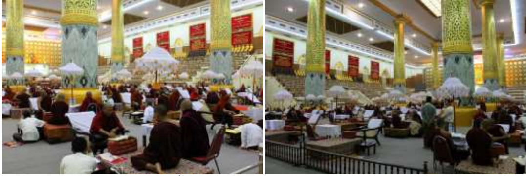
ภาพที่ 9 ภาพการสอบผู้ทรงพระไตรปิฎก ณ ถ้ำปาสาณ กรุงย่างกุ้ง (Maha Pathana Cave in Thiri Mingalar Kaba Aye Hill in Yangon) (ภาพผู้เขียน : เมื่อ 10 มกราคม 2014/2558)

จนกระทั่งเมื่อวันที่ 17 มิถุนายน พ.ศ. 2558/2016 สำนักงานประธานาธิบดีพม่า (the Office of the President of Myanmar) ได้ออกคำสั่งแก้ไขเพิ่มเติมระบบสมณศักดิ์ของพระสงฆ์พม่าเพิ่มเติมจากที่มีอยู่เดิมเป็น 7 หมวด ดังนี้