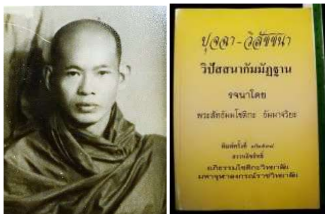
ภาพที่ 7 พระสัทธัมมโชติกะ ธรรมจาริยะ ผู้นำรูปแบบการเรียนการสอนอิทธิธรรม มาเผยแพร่ในประเทศไทย ในสมัยพระพิมลธรรม วัดมหาธาตุ ฯ

ในปี พ.ศ.2509/1966 ท่านได้อาพาธหนัก จนกระทั่งมรณภาพในที่สุด ซึ่งในประเทศไทยก็ถือว่าท่านเป็นผู้วางรากฐานด้านการเรียนการสอนอิทธิธรรมจนกระทั่งปัจจุบัน