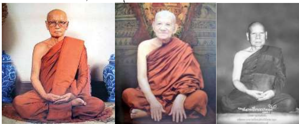
ภาพที่ 4 สมเด็จพระพุทธาจารย์ (อาจ อาสภะ) พระภัททันตะ อาสภะ พระมหาโชดก ญาณสิทธิ (พระธรรมธีรราชมหามุนี) ผู้ที่ นำรูปแบบการสอนกรรมฐานจากพม่า “สติปัฏฐาน 4” ยุบหนอ-พองหนอ เข้ามาเผยแผ่ยังประเทศไทย