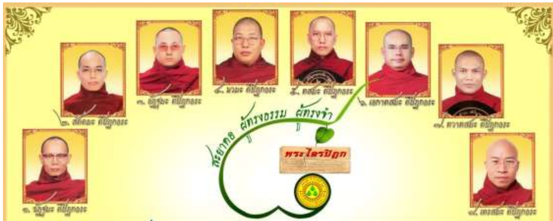
ภาพที่ 6 พระผู้ทรงจำพระไตรปิฎก ที่ในประวัติของพม่ามีผู้ทรงพระไตรปิฎกนับแต่อดีตกระทั่งปัจจุบัน จำนวน 14 รูป และท่านเหล่านี้ปัจจุบันยังมีชีวิต 11 รูป

ถวายค่านิตยภัตให้ พร้อมทั้งอุปถัมภ์ค่าพาหนะ เช่น ขึ้นเครื่องบิน ขึ้นรถฟรี และสวัสดิการอื่นๆ ในอดีตที่ผ่านมา พระไตรปิฎกธรรมที่มีชื่อเสียง คือ พระอาจารย์ภักทันทะ วิจิตตะ สารากิวังสะปฐมตรีปิฎกเถระ ตรีปิฎกโกวิทะ ตรีปิฎกเถระธรรมกัณฑ์คาริกะ หรือเรียกอีกอย่างหนึ่งว่า ปฐมเม็งกุน สยาดอ เมืองสะกาย ท่านสามารถจำได้ทุกหน้าทุกบรรทัดราวกับเปิดข้อมูลจากคอมพิวเตอร์ จนกระทั่งกินเนสส์บุ๊ก ใน พ.ศ. 2528/1985 ซึ่งตีพิมพ์ในอังกฤษ ได้บันทึกความทรงจำที่น่ามหัศจรรย์ของท่านไว้ว่า “พระอาจารย์ใหญ่เม็งกุนสยาดอ ประเทศพม่า มีความทรงจำท่องพระไตรปิฎก 16,000 หน้า (240,000 ตัวอักษร) ได้ เมื่อเดือนพฤษภาคม พ.ศ. 2497/ค.ศ. 1954 ซึ่งเป็นตัวอย่างของความทรงจำของมนุษย์ที่หาได้ยากมาก นับแต่อดีตพระในสายผู้ทรงพระไตรปิฎกทั่วประเทศมีจำนวน 14 รูป คงเหลือในปัจจุบันที่ 11 รูป มรณภาพไปแล้ว 3 รูป มีท่านพระอาจารย์ภักทันทะ วิจิตตะ สารากิวังสะ รูปแรก เป็นต้น ซึ่งในสังคมพม่าเป็นที่ยกย่อง รวมทั้งทำหน้าที่ในการจัดการศึกษาให้กับศิษย์ในชั้นต่อ ๆ มาตามลำดับด้วยเช่นกัน