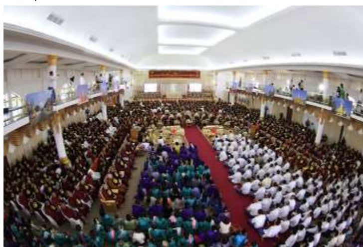
ภาพที่ 2 ภาพเหตุการณ์ประชุมสงฆ์นิกายกว่า 1 พันรูป พร้อมศาสนิกผู้นับถือ ที่วัด Dhammaduta Zetawon Tawya Monastery ในกรุงย่างกุ้ง ในเดือนกุมภาพันธ์ ค.ศ.2012