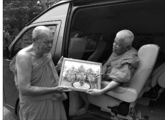
ภาพที่ 4 คณะผู้เขียนกับการเก็บข้อมูลและสัมภาษณ์เจ้าอาวาสวัดบางเปิด จังหวัดประจวบคีรีขันธ์ ภายใต้แนวทางเสริมสร้างสุขภาพทางจิตเพื่อเข้าสู่เป้าหมาย (ภาพ: คณะนักวิจัย, 24 สิงหาคม 2561)

1. เจตนาในการทำตนให้เป็นต้นแบบ หมายถึง ปณิธาน หรืออุดมคติ ในการทำตนให้เป็นต้นแบบ ดังพุทธพจน์ที่ว่า “ยถาวาที ตถากาโร - พุทอย่างไร ทำอย่างนั้น” หรือในความหมายอาจอธิบายได้ว่าภาพหนึ่งภาพ มีค่ามากกว่าคำสอน หลวงพ่อวัดบางเปิด ได้กระทำตนให้เป็นแบบอย่าง ทำให้เห็นว่าเป็นคนทำจริง มุ่งมั่นทุ่มเทจริง ดังนั้น การที่หลวงพ่อบางเปิดศึกษาหาความรู้ จึงมีความหมายเป็นการเรียนเพื่อพัฒนาตนเอง บนฐานคิดที่ว่า “ ไม่มีใครแก่เกินเรียน ” ทั้งจะยังให้เป็นแบบอย่างแก่ลูกหลาน หรือภาพจำแก่ลูกหลาน เพราะการที่คนหนึ่งคนจะมีอายุยืนนานได้เกินกว่า 70-80 ปี นับเป็นเรื่องยากอยู่แล้ว การศึกษาในวัยสูงอายุ ยิ่งเป็นเรื่องยากยิ่งขึ้นไปอีก นอกจากนี้จะต้องถูกตั้งคำถามว่า หลวงพ่อเรียนไปทำไม เรียนไปเพื่ออะไร เพราะคนส่วนใหญ่จะเห็นว่าการเรียนเป็นเรื่องสำคัญก็จริง แต่วัยหลวงพ่อบางเปิด ไม่น่าจะเป็นวัยเรียนแล้ว หรือเรียนแล้วจะมีประโยชน์อันใด ในความเข้าใจของคนทั่วไป จึงทำให้เห็นว่าเป็นจริง ๆ แล้ว การเรียนรู้ตลอดชีวิต จึงเป็นเป้าหมายของชีวิตตามแนวพุทธ เพื่อพัฒนาคุณภาพชีวิตและการเรียนรู้ ซึ่งก็กลมกลืนมิตรเพื่อนร่วมเรียนของท่านส่วนใหญ่ก็สะท้อนอารมณ์และความรู้สึกอย่างนั้นด้วย ดังปรากฏที่ว่า