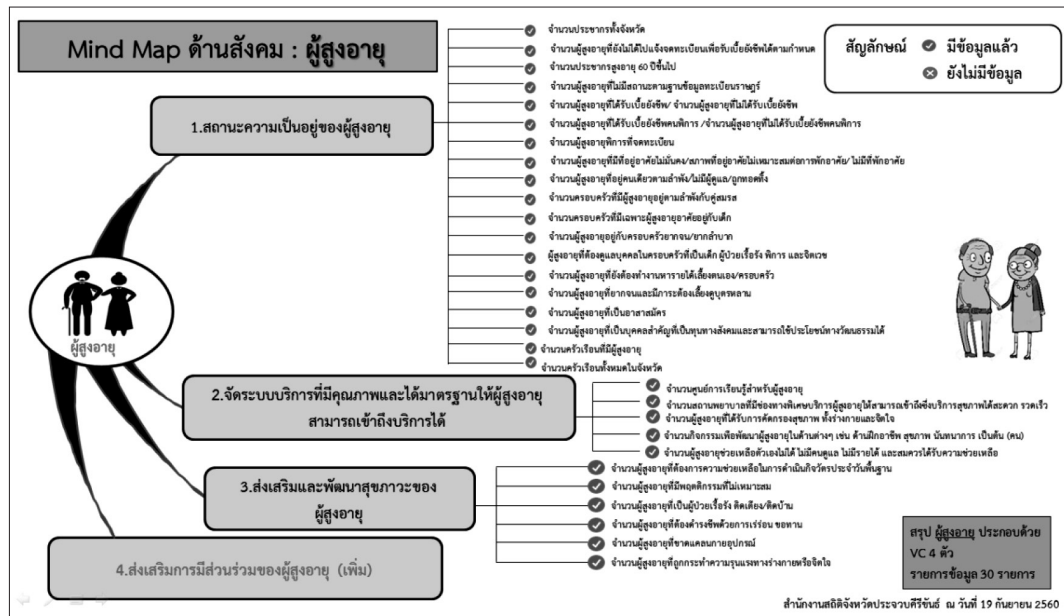
ภาพที่ 3 สำนักสถิติจังหวัดสมุทรปราการกับแนวทางในการจัดการและบริหารผู้สูงอายุ ในจังหวัดประจวบคีรีขันธ์

จากภาพที่ 3 มีการวางแผนทางเพื่อศึกษาสภาพปัญหาในองค์กรรวมทั้งสถานภาพของผู้สูงอายุในจังหวัดประจวบคีรีขันธ์ รวมทั้งพยายามเข้าไปจัดการสร้างระบบให้ผู้สูงอายุเข้าถึงการให้บริการในนามภาครัฐ รวมไปถึงการจัดสวัสดิการให้ได้มีคุณภาพมาตรฐานเหมาะสมกับผู้สูงอายุ รวมทั้งสร้างกลไกร่วมในการเข้าไปพัฒนาระบบสุขภาพของผู้สูงอายุด้วยเช่นกัน และส่งเสริมให้ผู้สูงอายุเข้ามามีส่วนร่วมกับกิจกรรมในองค์กรของผู้สูงอายุด้วยเช่นกัน ดังนั้น หากพิจารณาในองค์กรรวมทั้งในส่วนตาราง และแผนภาพที่ปรากฏเกี่ยวกับผู้สูงอายุในจังหวัดประจวบคีรีขันธ์กำลังได้รับการบริหารจัดการโดยภาครัฐและหน่วยงานที่เกี่ยวข้อง ซึ่งจะขยายและเติบโตเป็นกลไกร่วมในการส่งเสริมสุขภาพสำหรับผู้สูงอายุในจังหวัดประจวบคีรีขันธ์ต่อไปได้