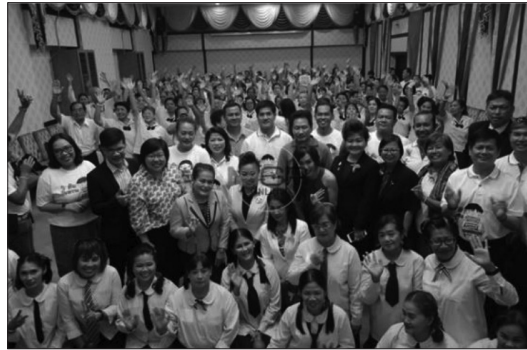
ภาพที่ 2 โรงเรียนวัยหวาน ของจังหวัดประจวบคีรีขันธ์ ภาพสะท้อนการจัดการจัดการผู้สูงอายุให้มีศักดิ์ศรี และคุณภาพชีวิตตามแนวพุทธ ที่จะพึงเกิดขึ้น