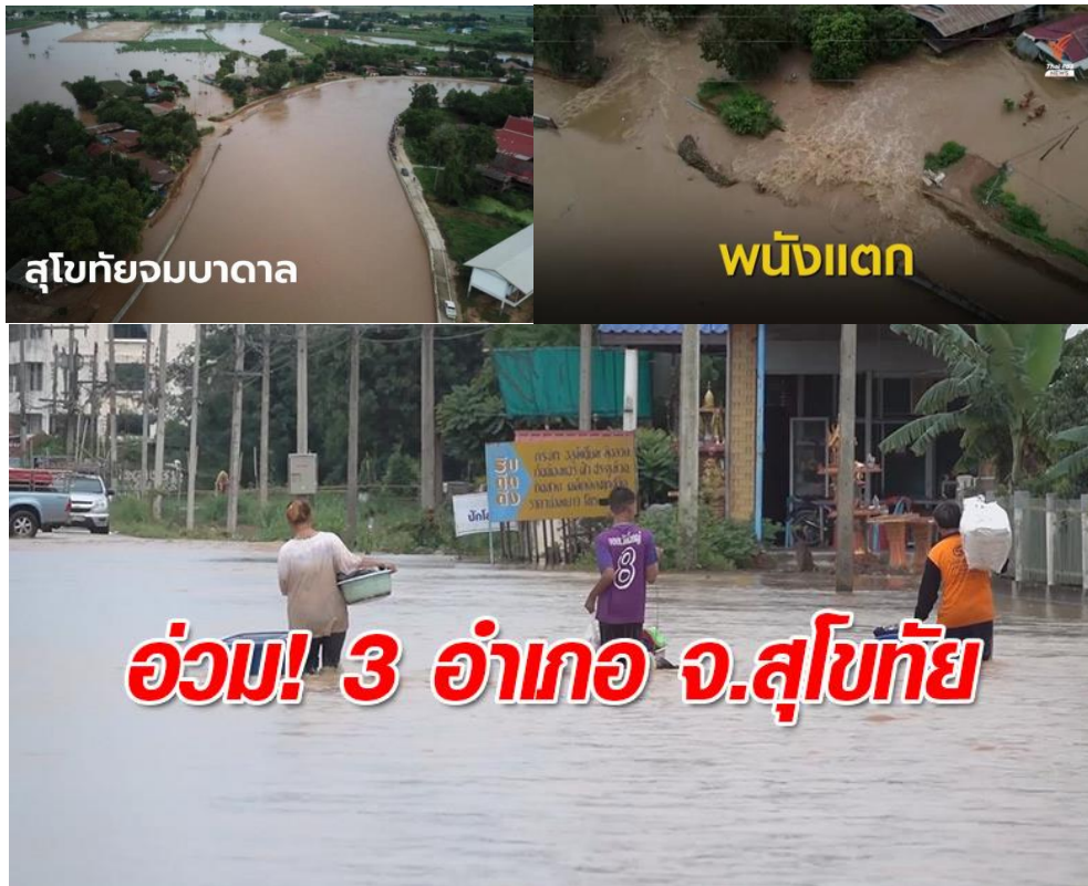
ภาพที่ 1 สถานการณ์ พน้ำกั้นน้ำพ้ำง ของจังหวัดสุโขทัย สิงหาคม 2563