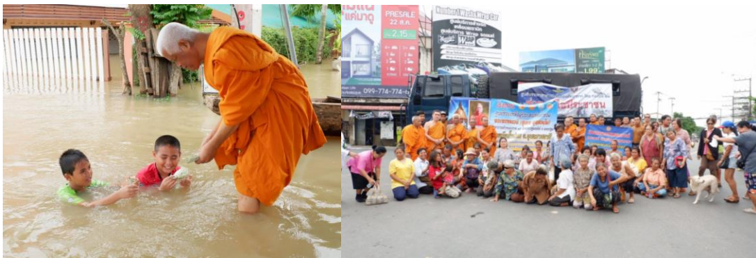
ภาพที่ 5 การช่วยเหลือผู้ประสบภัยน้ำท่วม ที่จังหวัดอุบลราชธานี เมื่อ พ.ศ.2561 กับเครือข่ายสาธารณะสงเคราะห์จังหวัดอุบลราชธานี (ภาพ วัดอินทาราม จ.สมุทรสงคราม 2561)

ตัดกลับมาที่บทบาทพระสงฆ์กับการช่วยเหลือสังคมในสถานการณ์น้ำท่วม จากภาพสื่อสารสาธารณะจะพบข้อมูลว่า เมื่อปี 2562 หลวงพ่อแดง นนทิโย ในนามกลุ่ม “สังฆประชาชนเคราะห์” ที่มีบทบาทเข้าไปช่วยเหลือประชาชนในสถานการณ์ยากลำบาก ได้ไปช่วยเหลือผู้ประสบภัยน้ำท่วม นำสิ่งใช้ไปแจกให้กับผู้ประสบภัยที่ จ.อุบลราชธานี หรือให้การช่วยเหลือผู้ประสบภัยน้ำท่วมที่ จ.เลย ระหว่างเดือนกรกฎาคม 2563 ที่ยกมาต้องการบอกว่าพระสงฆ์ส่วนหนึ่งมีบทบาทในการช่วยเหลือสังคม (ตามภาพประกอบ 5) ทั้งอีกนัยหนึ่งต้องการสื่อสารว่าเครือข่ายการช่วยเหลือ ของพระสงฆ์มีทั่วประเทศ ปฏิบัติตามหลักการทางพระพุทธศาสนาที่ว่า “บำเพ็ญประโยชน์ส่วนรวม” ตามหลักการทางพระพุทธศาสนา “สังคหวัตถุ” เป็นฐานในการสงเคราะห์ประชาชน เพื่อให้ชีวิตขยับก้าว บรรเทาเบื้องต้น พร้อมไปต่ออย่างมีเป้าหมาย จึงนับเป็นพันธกิจภารกิจของเครือข่ายพระสงฆ์นักพัฒนา ที่มีหลวงพ่อแดง นนทิโย แห่งวัดอินทาราม จ.สมุทรสงคราม เป็นเครือข่ายสมาชิกขับเคลื่อนกิจกรรมเพื่อบรรเทาสาธารณภัยรวมอยู่ด้วย